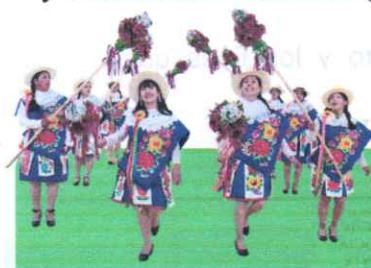
Danzas y Costumbres Tanta - Yauyos

Que, la Política Nacional del Ambiente al 2030 aprobada por Decreto Supremo N° 023-2021-MINAM prevé como Objetivo Prioritario N° 9 mejorar el comportamiento ambiental de la ciudadanía, disponiendo en su servicio OP9.S1, que el Ministerio del Ambiente deberá fortalecer las capacidades institucionales a los gobiernos subnacionales, para la incorporación del enfoque ambiental en la educación comunitaria; estableciendo como indicador de cobertura el porcentaje de gobiernos locales que reportan la implementación de su Programa Municipal de Educación, Cultura y Ciudadanía Ambiental (Programa Municipal EDUCCA);