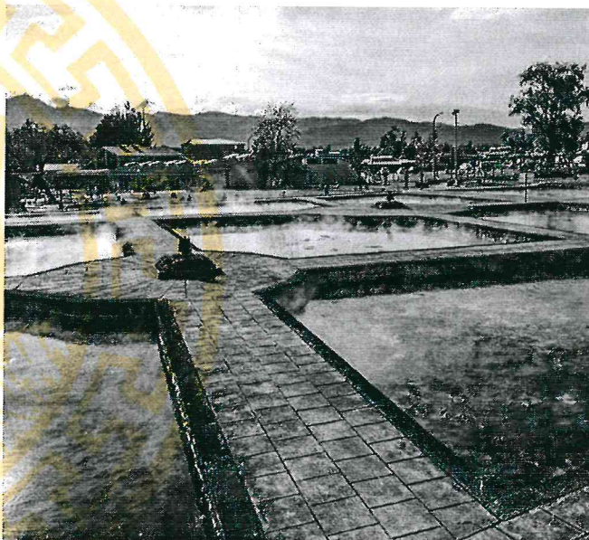
Los Baños del Inca, Cajamarca, Cajamarca