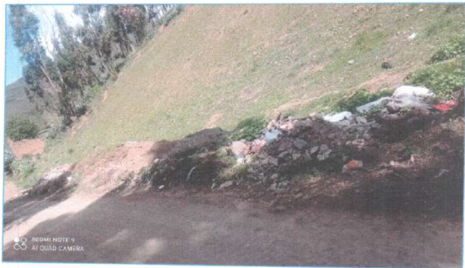
Ilustración N° 05: Punto crítico identificado en el Jr. María Parado de Bellido (cuadra 1) y Jr. Córdova (cuadra 1).