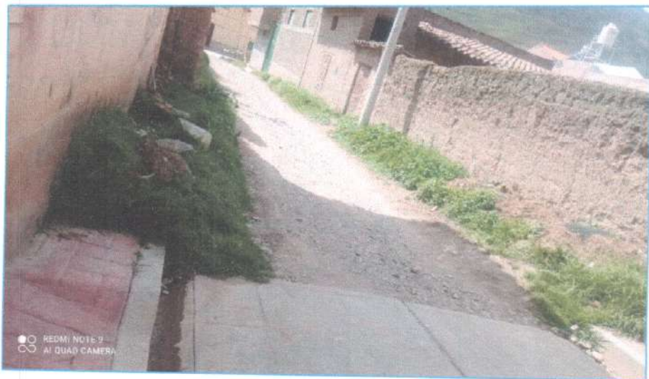
Ilustración N° 03: Punto crítico identificado en el Ovalo (pasaje SN) entre Jr. Grau y Jr. Moore.