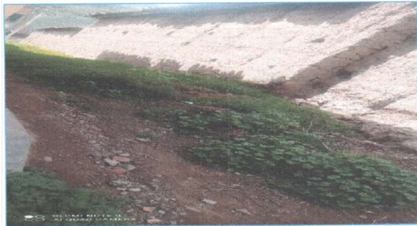
Ilustración N° 04: Punto crítico identificado en el Jr. San Cristóbal (cuadra 1) y Jr. Necochea (cuadra 1).