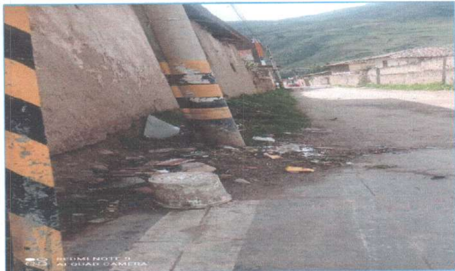
Ilustración N° 02: Punto crítico identificado en el Jr. Santos Chocano (cuadra 2) y Jr. Grau.