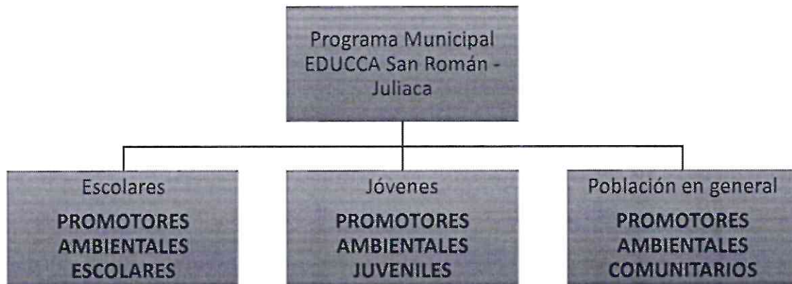
Cuadro N° 2. Población objetivo del Programa EDUCCA

El Programa Municipal EDUCCA San Román - Juliaca, cuenta con la siguiente población objetivo: