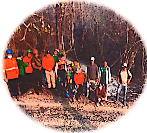
5. Incendios Forestales