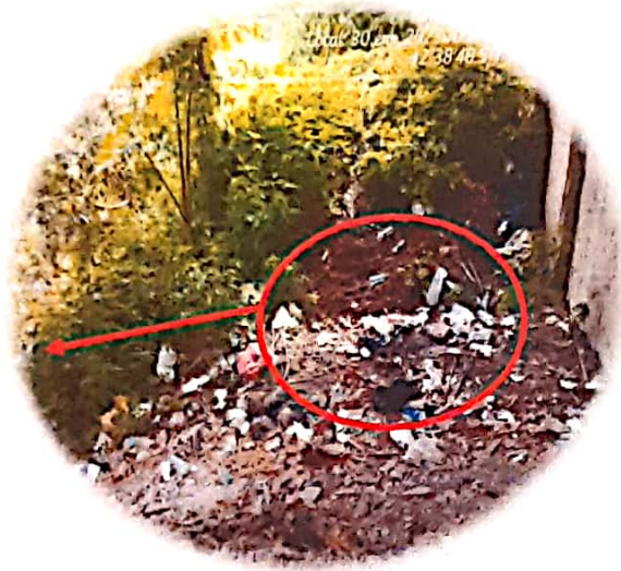
7. Contaminación de recurso hídrico