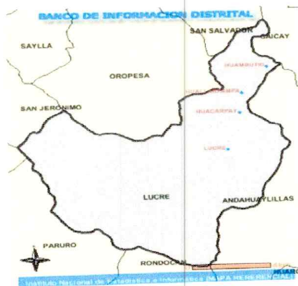
Gráfico N°1: Ubicación

El distrito de Lucre es uno de los doce distritos de la provincia de Quispicanchi, ubicada en el departamento del Cuzco, Perú, bajo la administración del Gobierno regional del Cuzco.