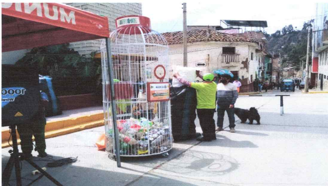
Fotografía 04. Campaña de reciclaje en la plaza principal de la ciudad de San Miguel (Fuente: Página oficial de Facebook de la Municipalidad Provincial de La Mar).

actividad se utilizara recursos como afiches, trípticos, calendarios y recurso humano (promotores ambientales).