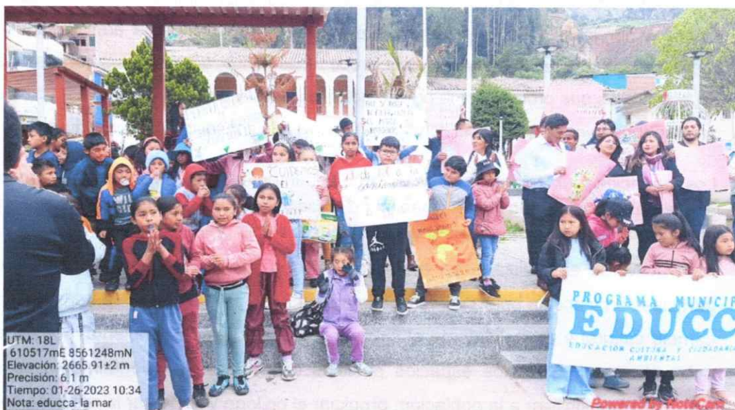
Fotografía 03: Participación de escolares en las campañas ambientales