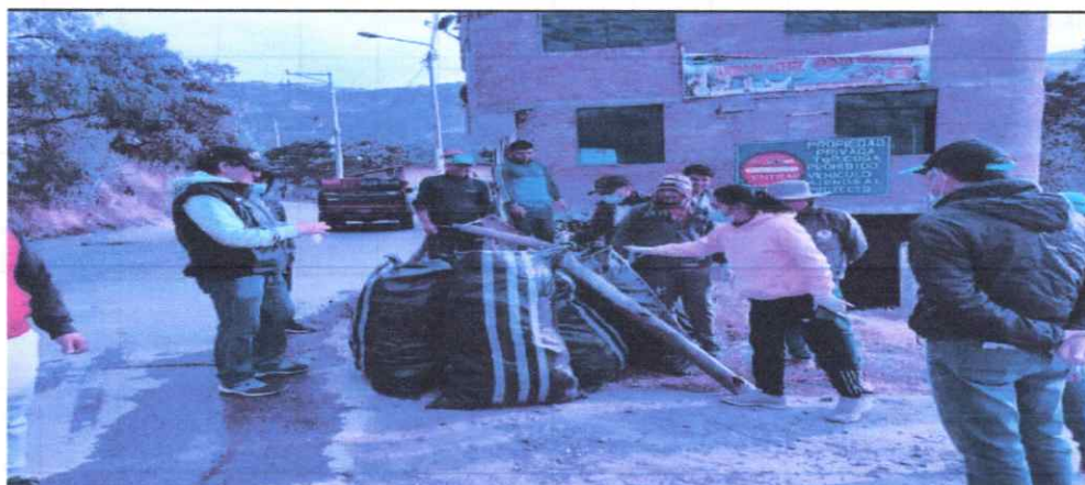
Fotografía 09. Faenas de limpieza de zonas críticas en las comunidades.

Los Promotores Ambientales Comunitarios (PAC) son ejes articuladores de las estrategias de educación ambiental, son líderes comunitarios y desarrollan proyectos y programas de apoyo a sus comunidades, generalmente enmarcados por procesos de sensibilización y educación a sus comunidades. Su quehacer se enmarca en la participación ciudadana, el control social a la gestión ambiental, la organización de sus comunidades en torno a la solución de las problemáticas ambientales, la preservación de las tradiciones culturales, la formulación de proyectos ciudadanos de educación ambiental, socio ambientales y de Educación Ambiental, para el desarrollo de esta actividad se realizarán reuniones en los diferentes barrios, centros poblados y comunidad invitando a la población para que participen en las acciones de sensibilización y educación ambiental del programa municipal EDUCCA-La Mar, como meta se tiene centros poblados y/o comunidades que participan del Programa Municipal EDUCCA, 20 PAC acreditados, 02 charlas y/o talleres dirigidos a los PAC, 05 actividades y/o campañas informativas en la que participan los PAC, para ello se utilizarán diferentes recursos tales como: afiches, trípticos. Finalmente, la actividad de formación de promotores ambientales comunitarios culminará con 20 PACs reconocidos.