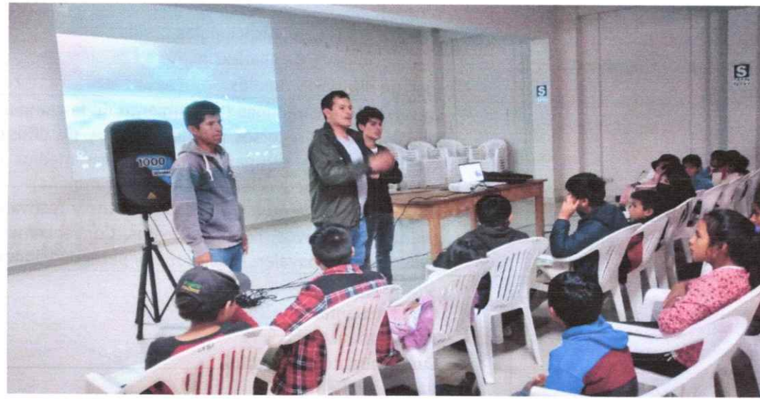
Fotografía 07. Desarrollo de eventos sobre el cuidado del medio ambiente – Proyección de películas