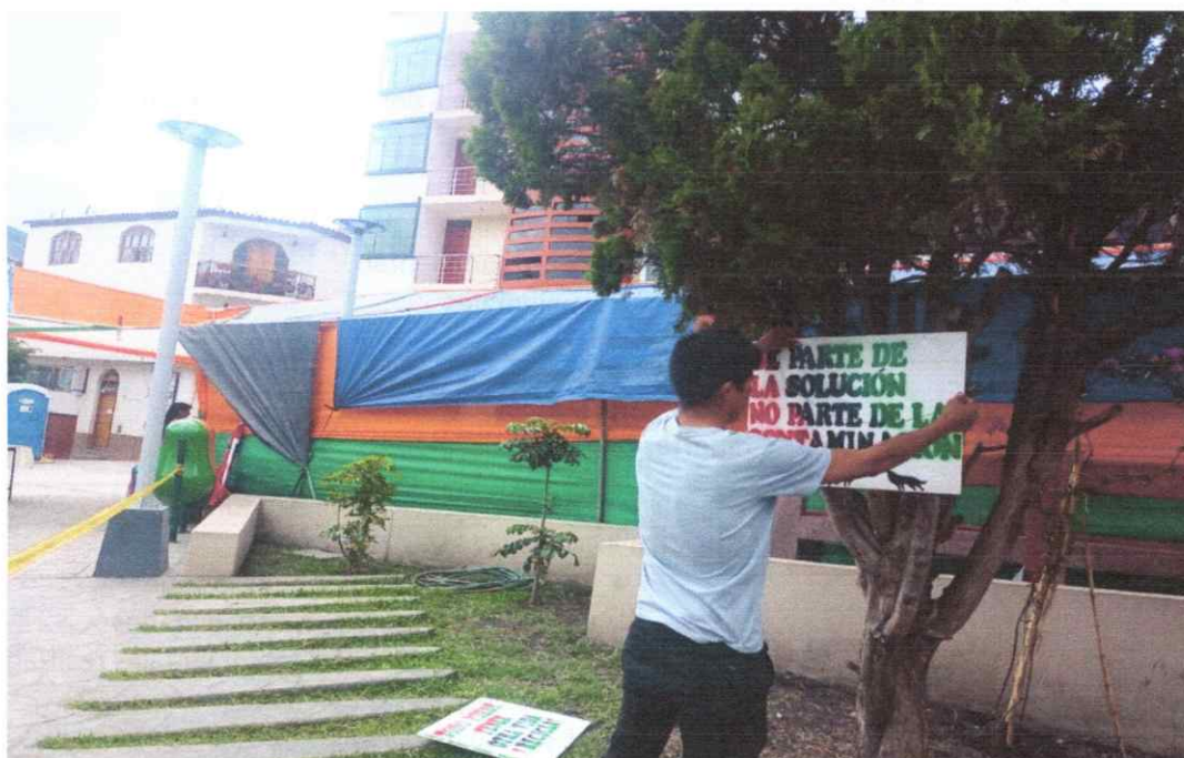
Fotografía 05. Colocación de avisos sobre el cuidado del medio ambiente