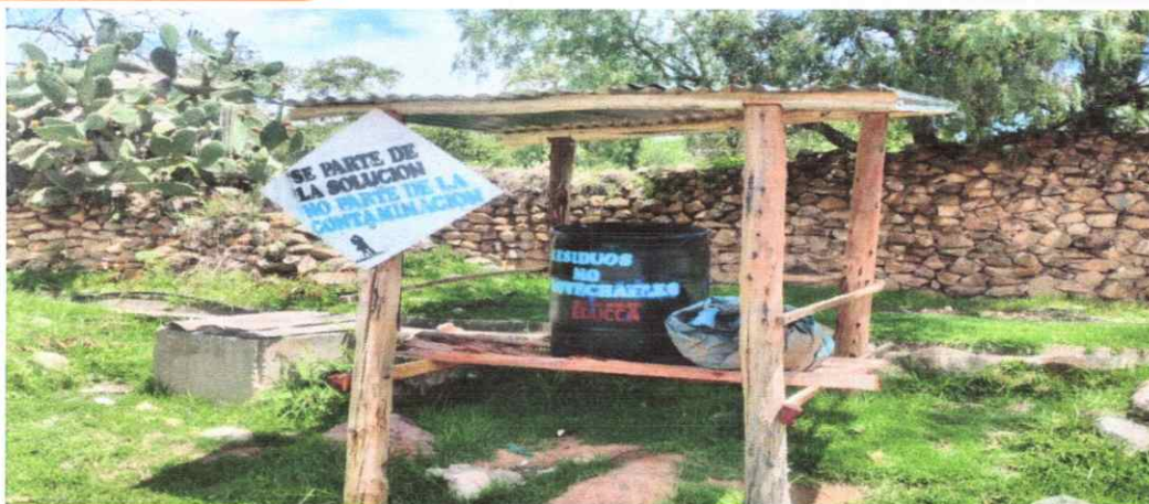
Fotografía 10. Habilitación de centro de acopio de residuos sólidos en las comunidades

e) Los indicadores que se reportarán en esta actividad