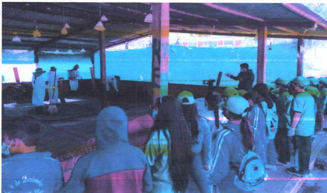
Fotografía 06. Pasantía de Escolares a la Infraestructura de Relleno Sanitario de San Miguel

En el distrito San Miguel, para el desarrollo de esta actividad se realizarán capacitaciones en temas de educación ambiental (Correcta segregación de residuos sólidos, Importancia de las 3 R, Consumo responsable de plásticos de un solo uso y envases de Tecnopor y Jornada de sensibilización a las viviendas del distrito de San Miguel sobre la correcta segregación de los residuos sólidos; a su vez en la comunidades y/o centros poblados), como meta para esta actividad se tiene 02 campañas informativas realizadas, 300 personas alcanzadas por publicación en redes sociales, 8 flyer, generados, 5 horas de perifoneo y 05 horas de difusión radial, 14 eventos de capacitación a la población y 280 personas que participan en eventos, se utilizarán diferentes recursos entre materiales como afiches, trípticos, flyers, banners y promotores ambientales para realizar las reuniones de capacitación.