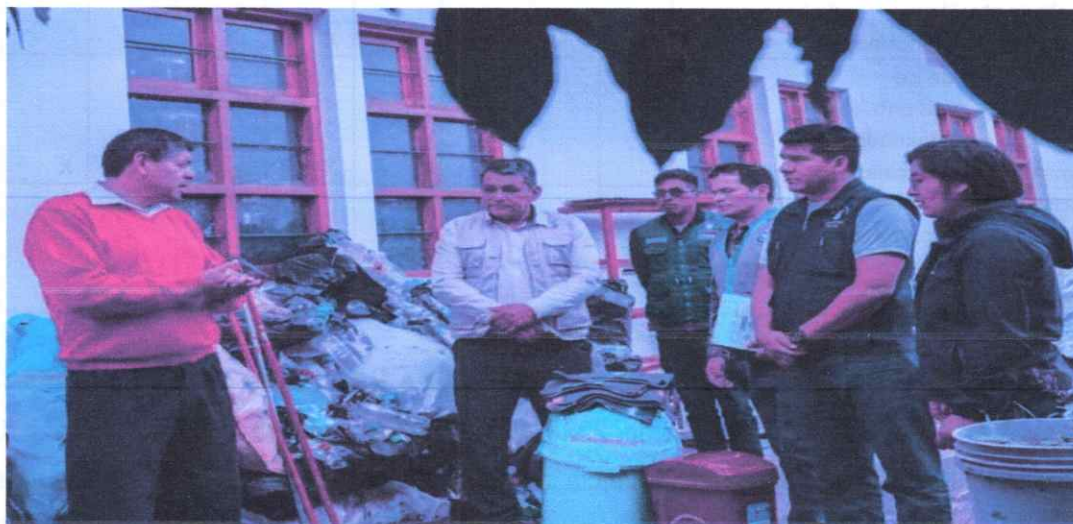
Fotografía 01. Entrega de incentivos por la práctica de reciclaje en colegios.