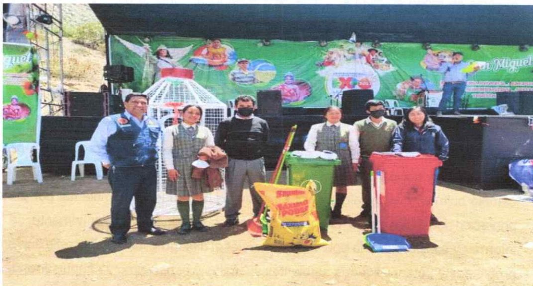
Fotografía 02: Entrega de incentivos por la práctica de reciclaje en colegios.

"Año de la unidad, la paz y el desarrollo"