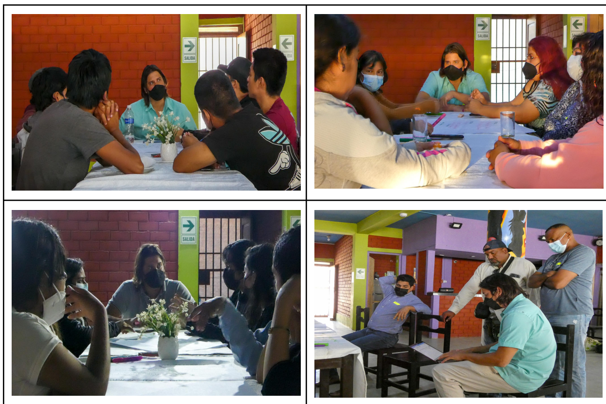
Foto 5. Las cuatro dinámicas grupales en Negritos