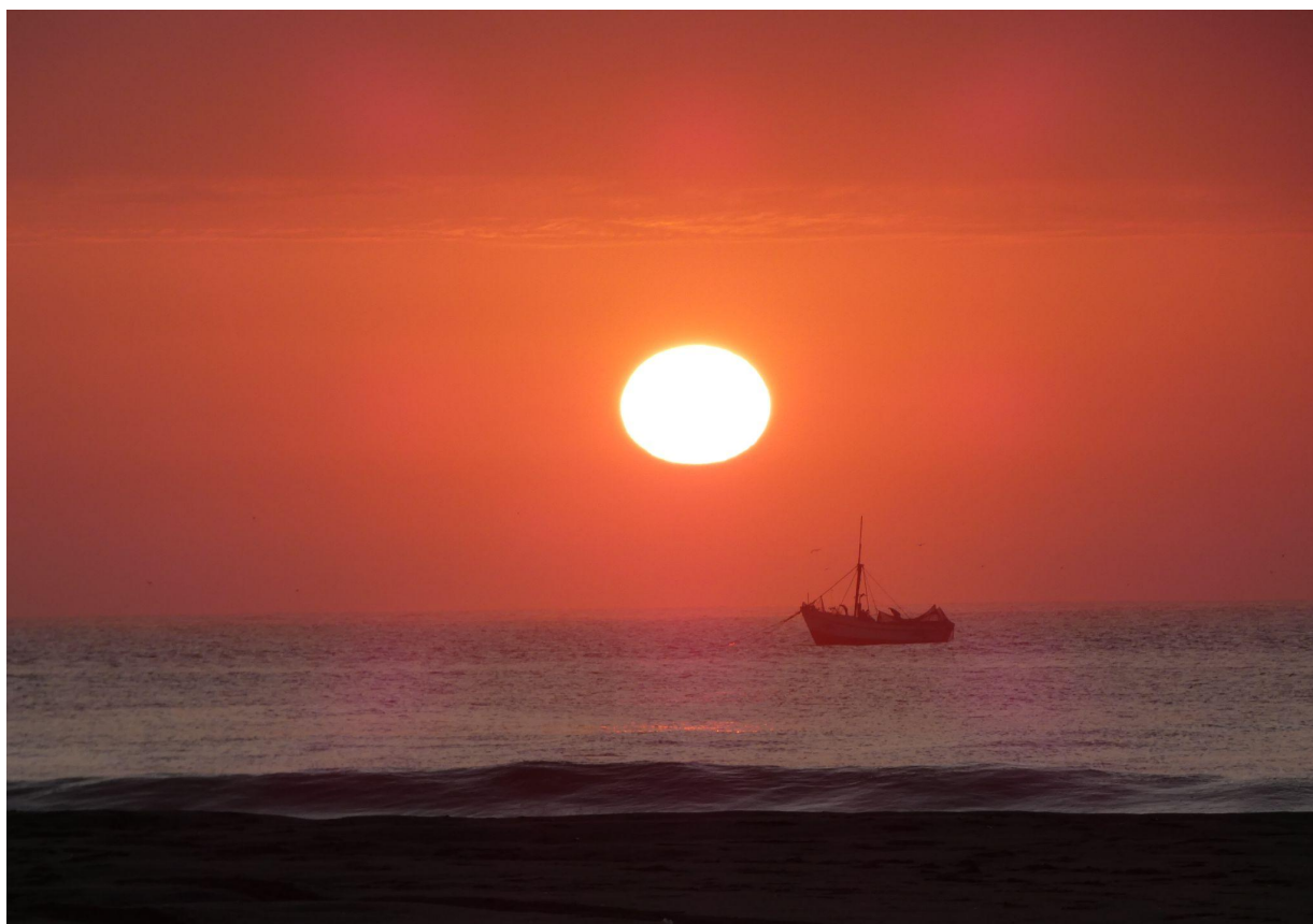
Foto 6. Atardecer en Negritos