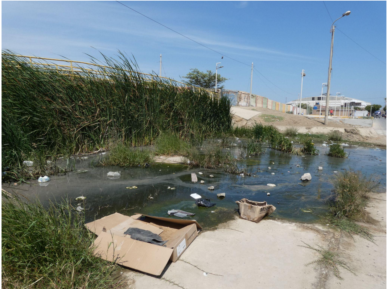
Foto 2. Residuos sólidos en el canal

directa de la institución pública más próxima, la Municipalidad de Negritos. Para fortalecer las probabilidades de éxitos del proyecto Ecoturístico, el objetivo de impulsar mejoras en la gestión de los residuos sólidos desde la Municipalidad debe agregarse al proyecto. Los trabajadores municipales, además, reconocen que esta es tarea suya, lo que significa que deben y pueden abordarla.