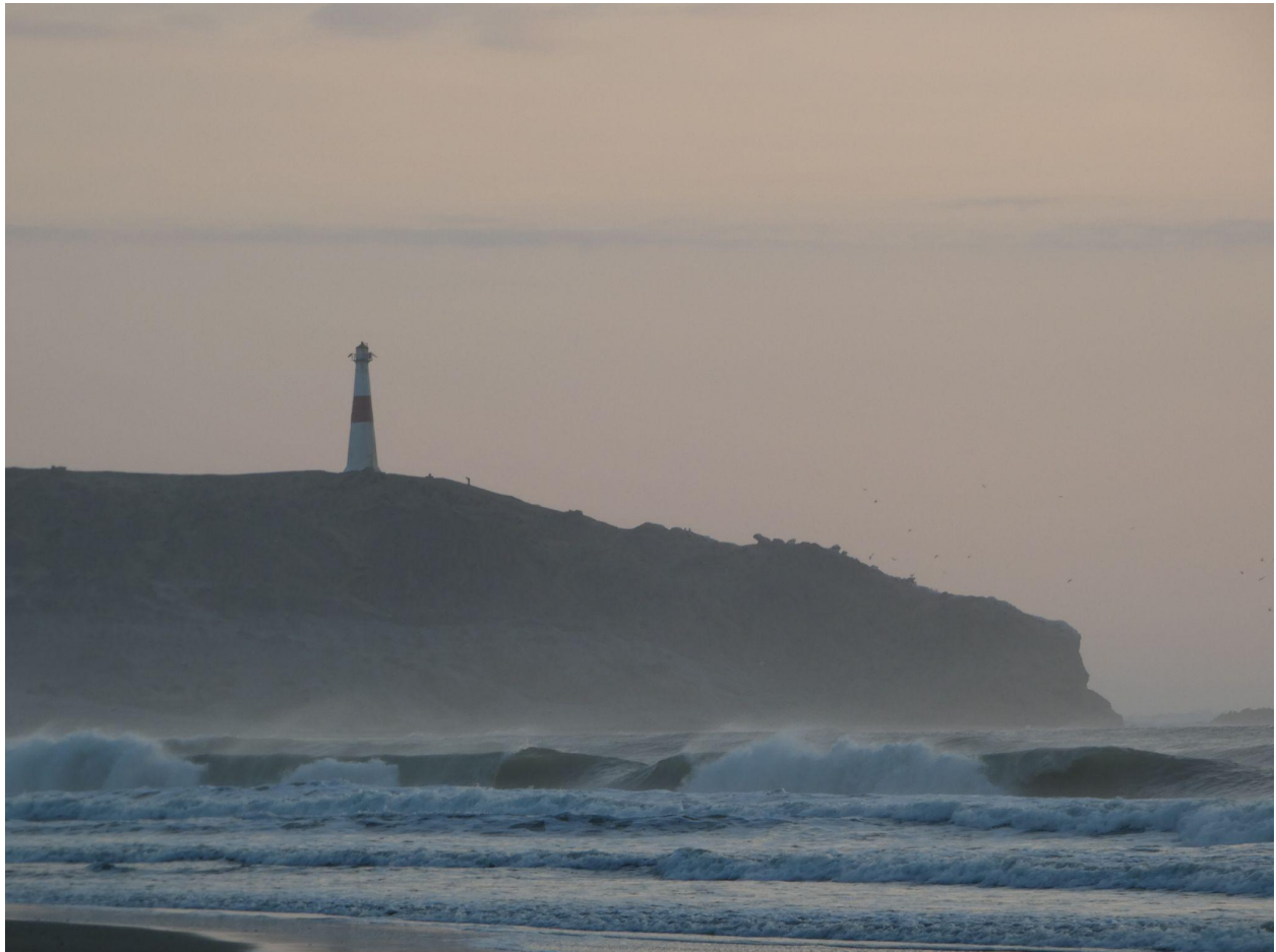
Foto 4. El Faro, uno de los atractivos turísticos de Negritos