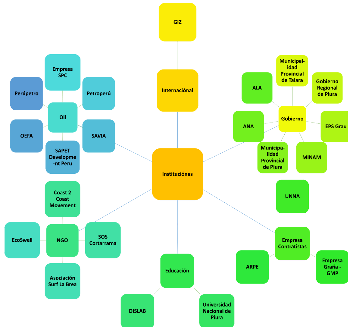
Fig. 1 Stakeholder Map