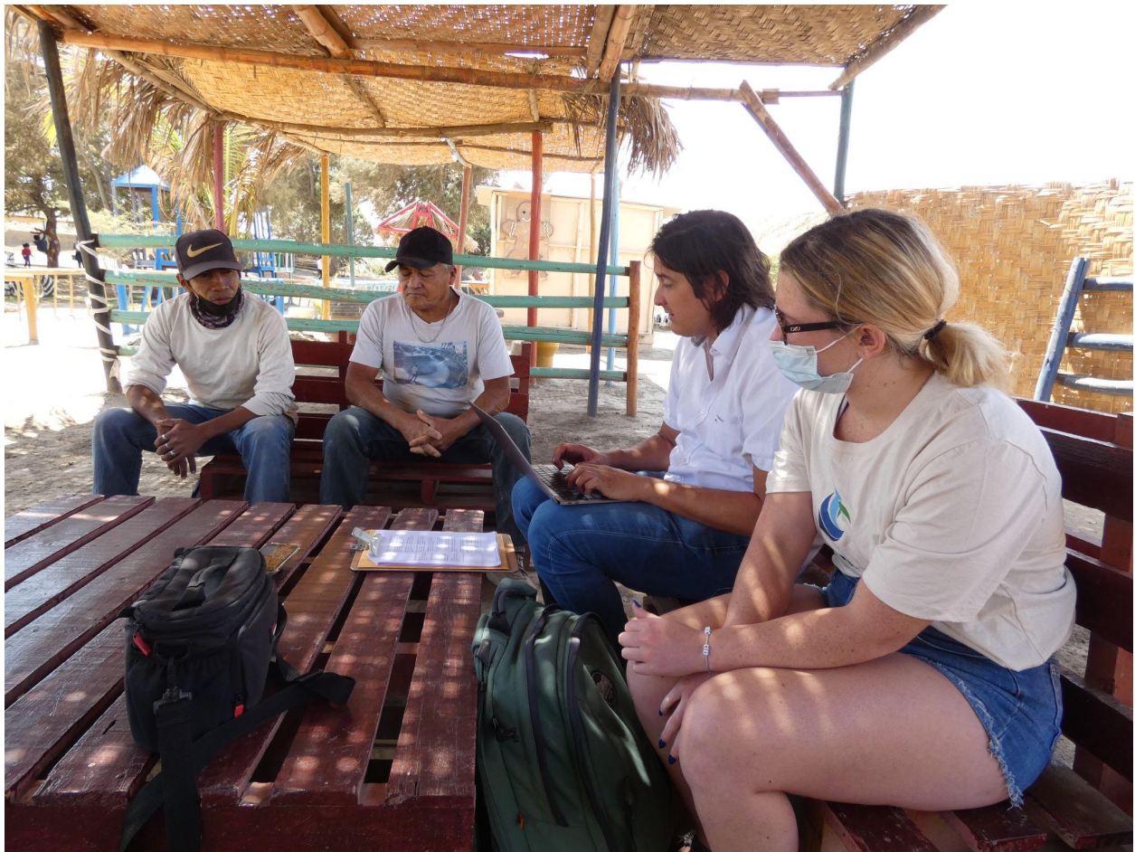
Foto 1. Entrevista con Trabajadores Municipales

como meta del proyecto a la hora de conversar con este grupo de stakeholders, particularmente si se trata de un municipalista de cargo administrativo o con autoridad política.