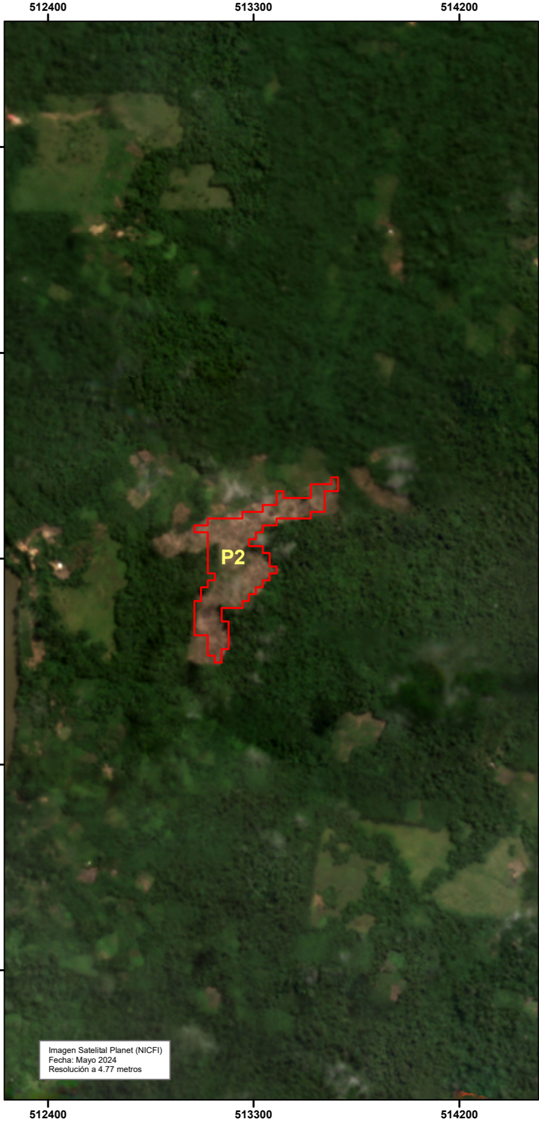
Imagen Satelital Planet (NICFI) Fecha: Mayo 2024 Resolución a 4.77 metros

Imagen Satelital Planet (NICFI) Fecha: Marzo 2024 Resolución a 4.77 metros