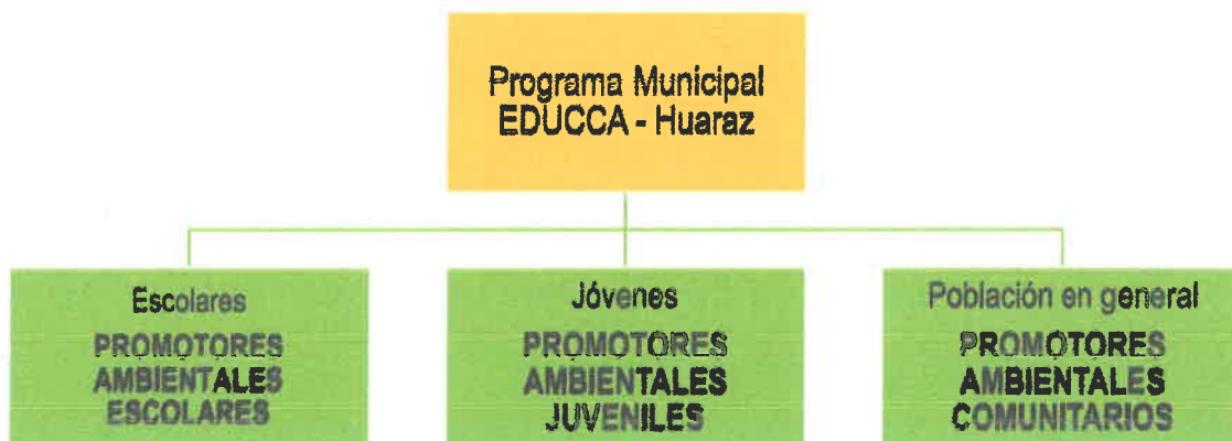
Ilustración 2: Población objetivo

La formación de promotores ambientales escolares, busca promover, fortalecer y articular las acciones de educación ambiental que las instituciones educativas vienen desarrollando, ya que la comunidad educativa tiene un rol clave en la educación, cultura y ciudadanía ambiental. La promotoría ambiental escolar fomenta la participación de niñas, niños y adolescentes en la gestión ambiental local, promoviendo la corresponsabilidad ciudadana, para la preservación, el cuidado del ambiente y uso sostenible del ambiente y sus recursos mediante la promotoría ambiental escolar.