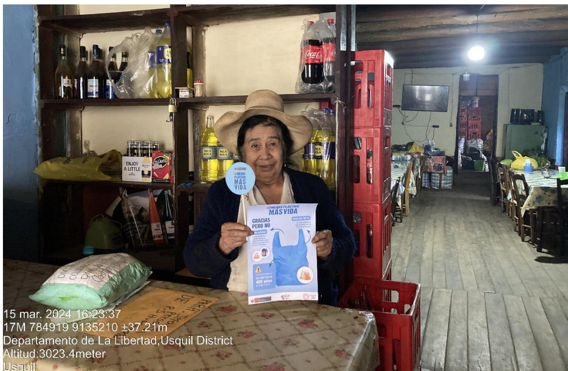
15 mar. 2024 16:23:37 17M 784919 9135210 ±37.21m Departamento de La Libertad, Usquil District Altitud: 3023.4meter Usquil.