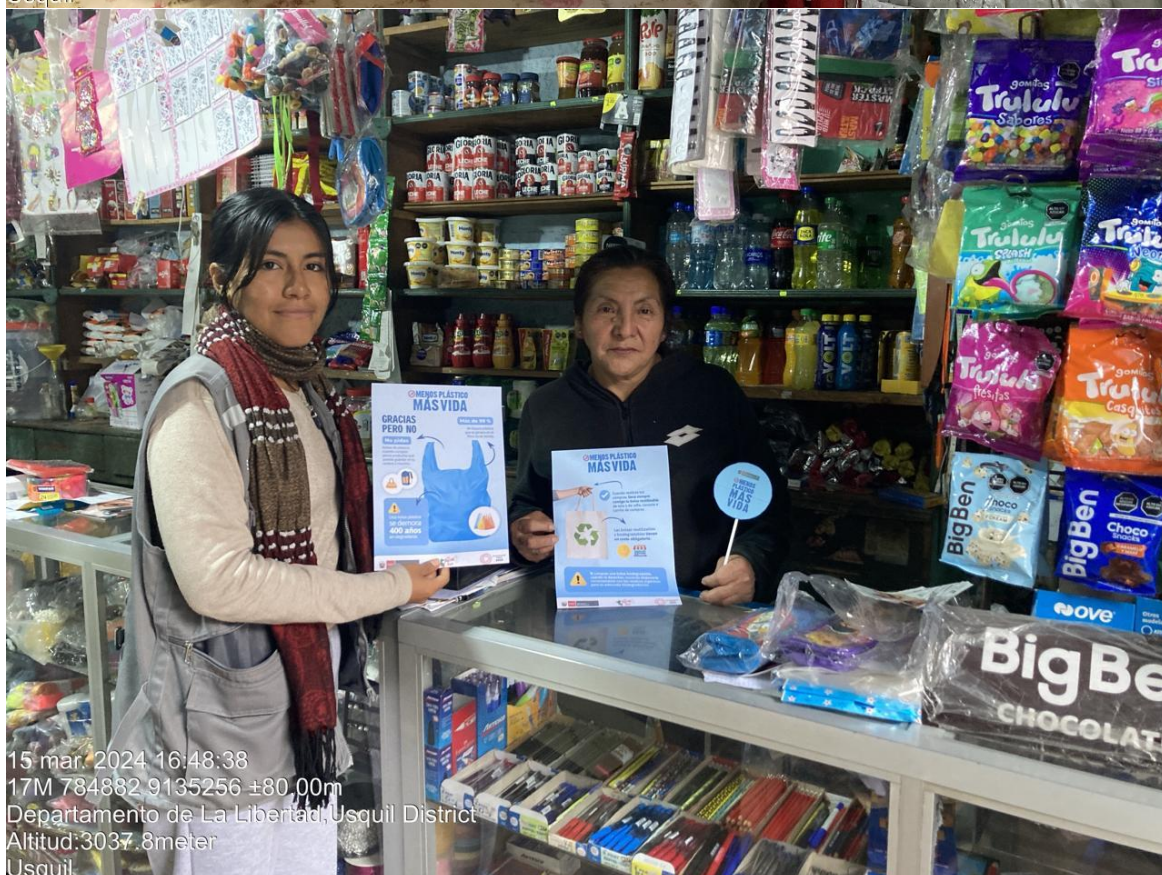
15 mar. 2024 16:48:38 17M 784882 9135256 ±80.00m Departamento de La Libertad, Usquil District Altitud: 3037.8meter Usquil.