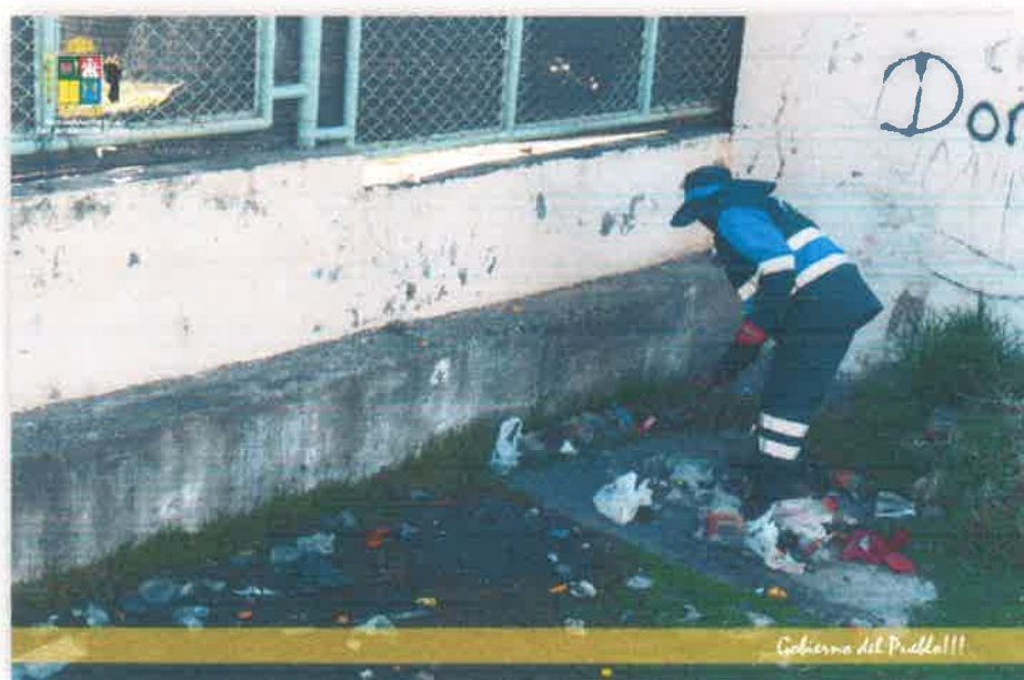
Imagen N° 28 : Fotografía del recojo de los Residuos Sólidos de la Losa deportiva