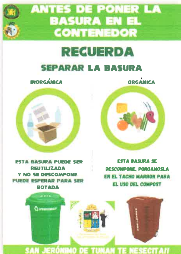
Imagen N° 08: Afiche de información ambiental

PROGRAMA MUNICIPAL EDUCCA EDUCACION, CULTURA Y CIUDADANIA AMBIENTAL