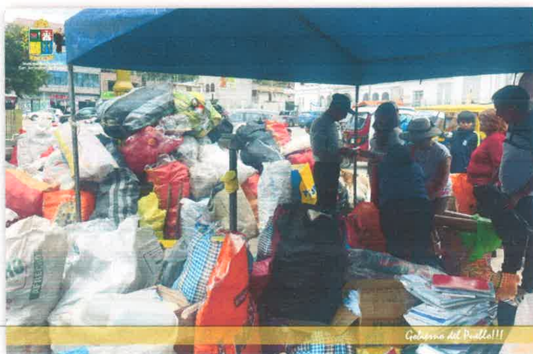
Imagen N° 38 : Fotografía de los residuos reciclables.

https://www.facebook.com/photo/?fbid=1212548669701427&set=a.930005641289066