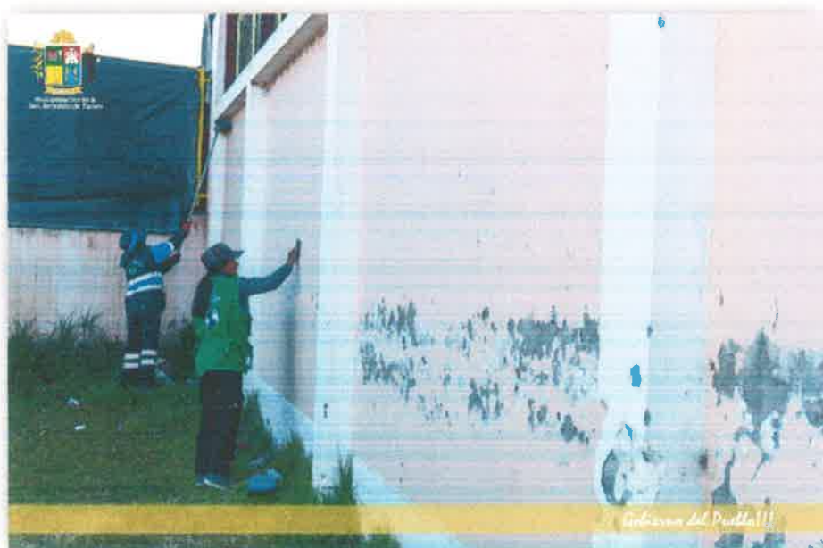
Imagen N° 27 : Fotografía del lijado de las paredes de la Losa