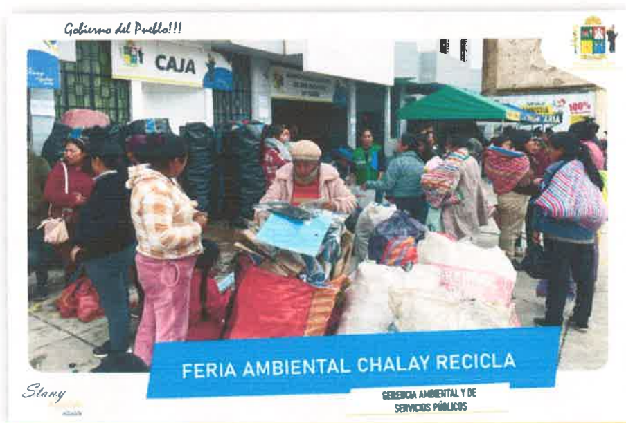
Imagen N° 34 : Fotografía de los residuos reciclables juntados por el Programa Vaso de Leche