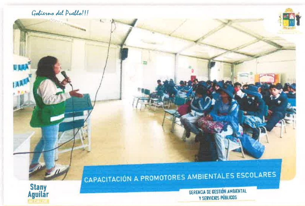
Imagen N° 03: Capacitación a los PAE - I.E. Esteban Sanabria Maravi