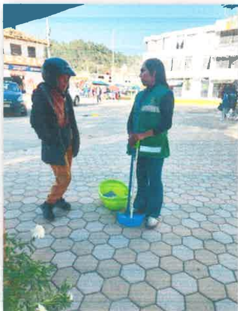
Imagen N° 22: Fotografía de la sensibilización al buen vecino Chalaysanto.