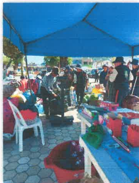
Imagen N° 18 : Fotografía de las instituciones educativas participantes del ECOTRUEQUE