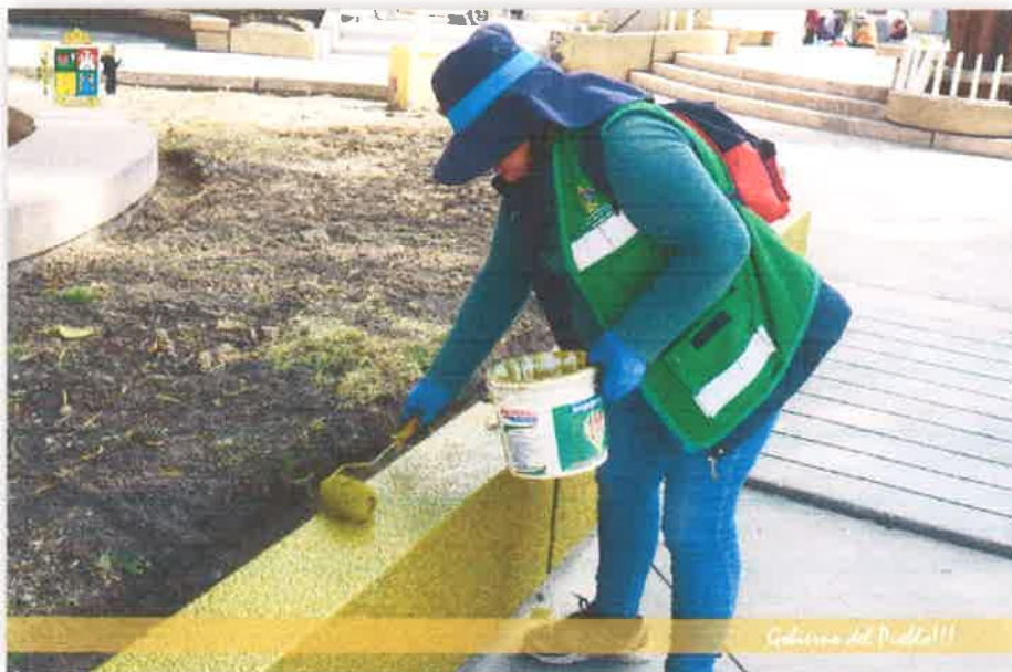
Imagen N° 32 : Fotografía del pintado de los bordes de las Áreas verdes del Parque Amoroso por los Promotores Ambientales Comunitarios