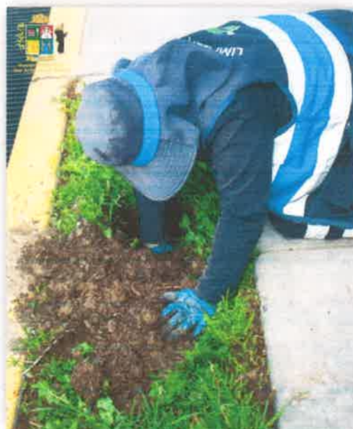
Imagen N° 11 : Fotografía de la limpieza de los huecos para la posterior plantación.