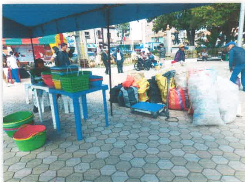
Imagen N° 26 : Fotografía del total de residuos reciclables recolectados en el ECOTRUEQUE ACUMULATIVO