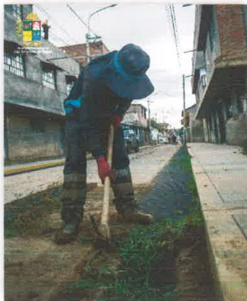
Imagen N° 14 : Fotografía del retirado de la grama de las canaletas