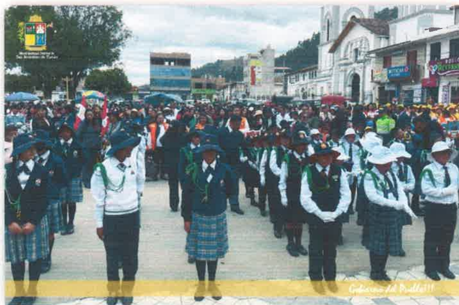
Imagen N° 02: Fotografía de la juramentación de la I.E. San Jerónimo y I.E. Esteban Sanabria Maraví.