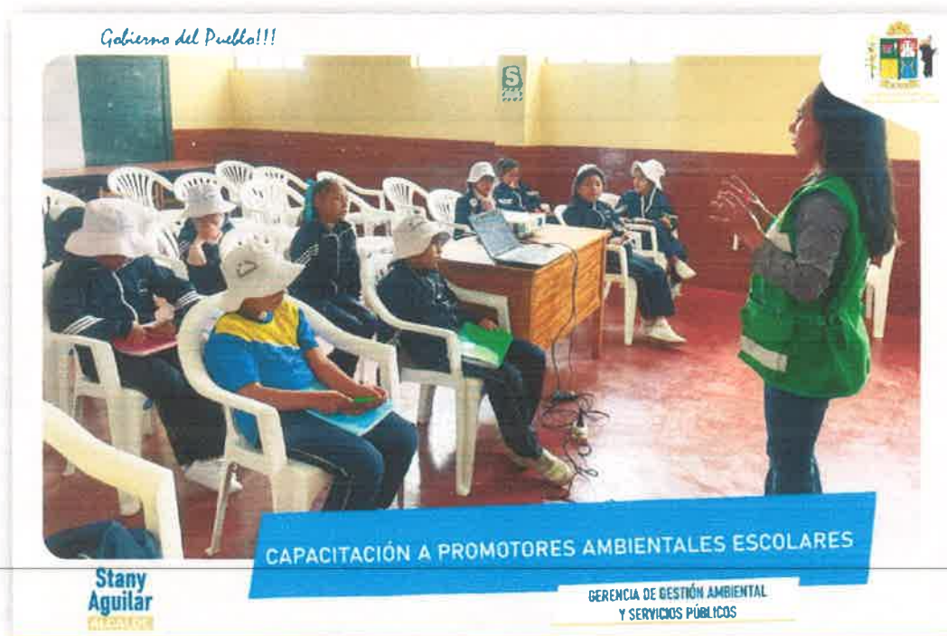
Imagen N° 04: Capacitación a los PAE - Institución Educativa N° 30244 "Juana Guerra Chávez"