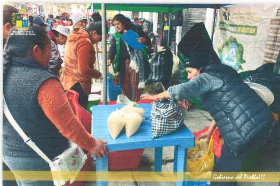
Imagen N° 37 : Fotografía del Intercambio de productos por sus residuos reciclables.