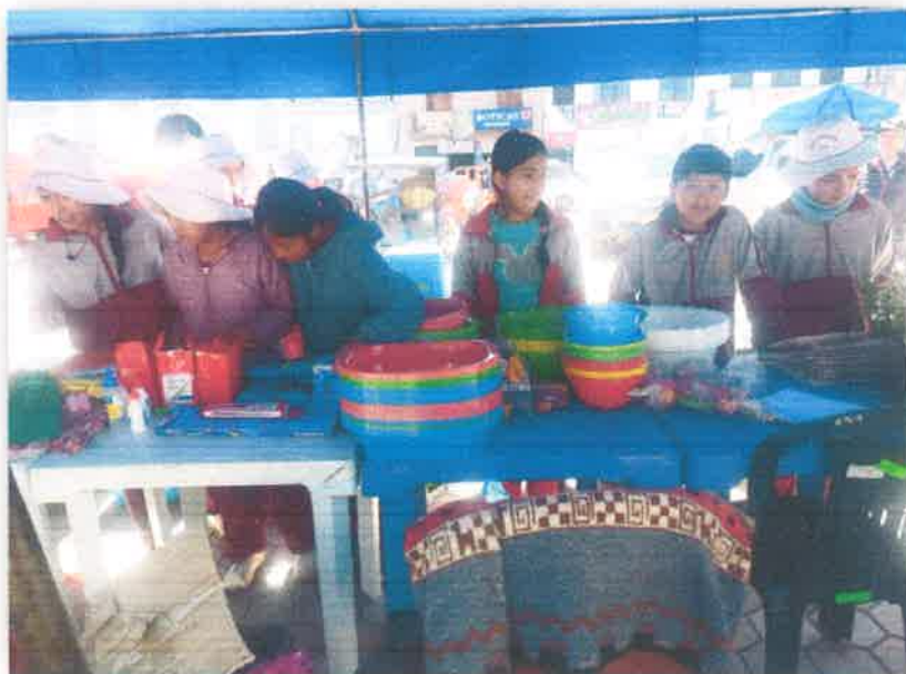
Imagen N° 20 : Fotografía de la entrega de incentivos a la Institución Educativa Mario Sánchez Mayta 30245