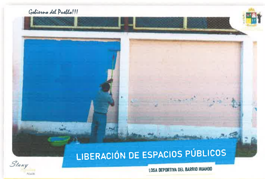
Imagen N° 29 : Fotografía del pintado de la Losa deportiva del Barrio Huando