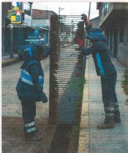
Imagen N° 13 : Fotografía del retirado de las rejas para su posterior limpieza