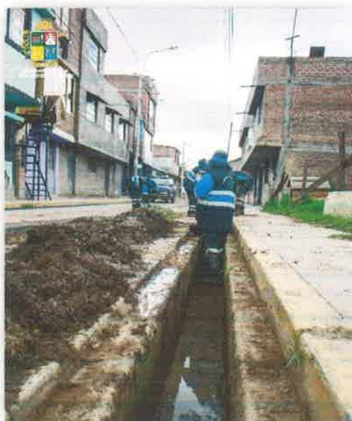
Imagen N° 15 : Fotografía del retirado barro y tierra de las canaletas