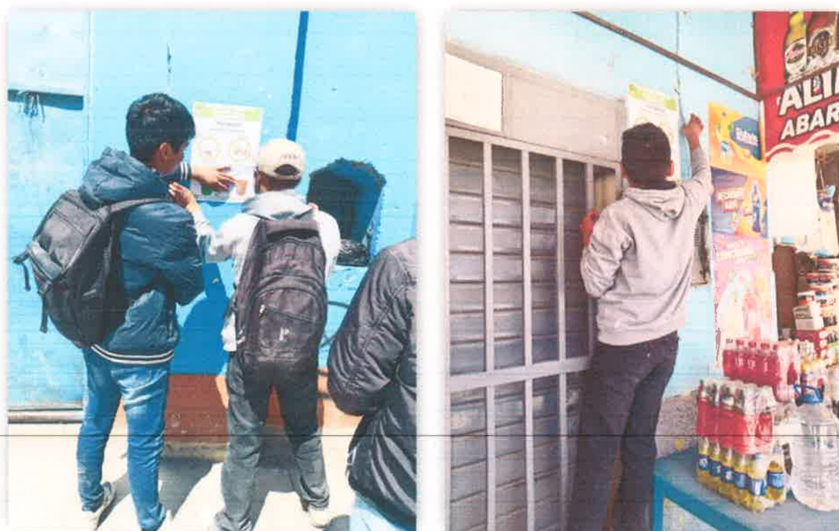
Imagen N° 09: Implementación de espacios que educan ambientalmente