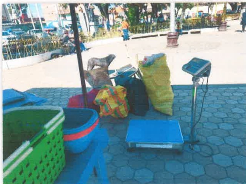
Imagen N° 25 : Fotografía de los residuos reciclables