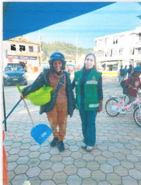
Imagen N° 23 : Fotografía de la entrega del kits de limpieza al buen vecino Chalaysanto.