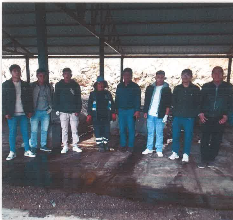
Imagen N° 47 : Visita Técnica a la Planta de Tratamiento de Residuos Sólidos con los promotores ambientales Juveniles