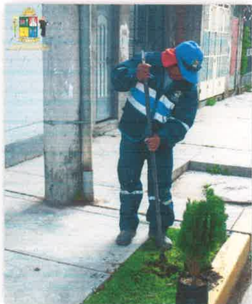
Imagen N° 10 : Fotografía al momento de realizar los huecos para la posterior plantación.