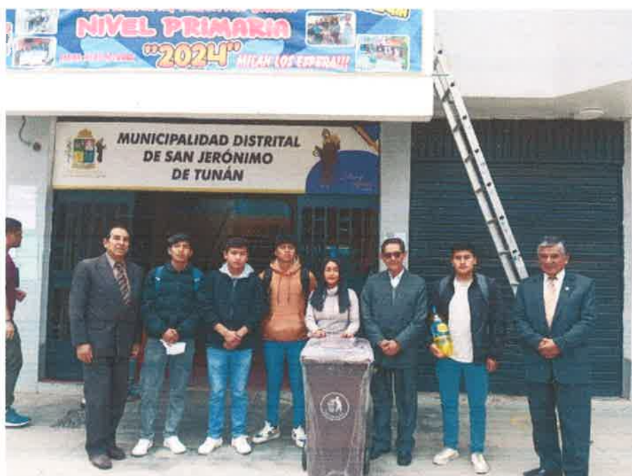
Imagen N° 46 : Implementación de punto Limpio en nuestro Distrito