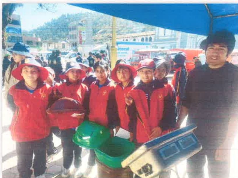
Imagen N° 19 : Fotografía de la entrega de incentivos a la Institución Educativa San Jerónimo.