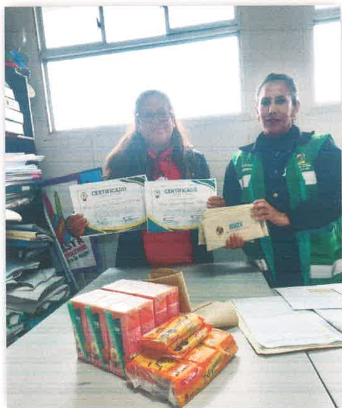
Imagen N° 07: Entrega de certificados - Institución Educativa Esteban Sanabria Maravi