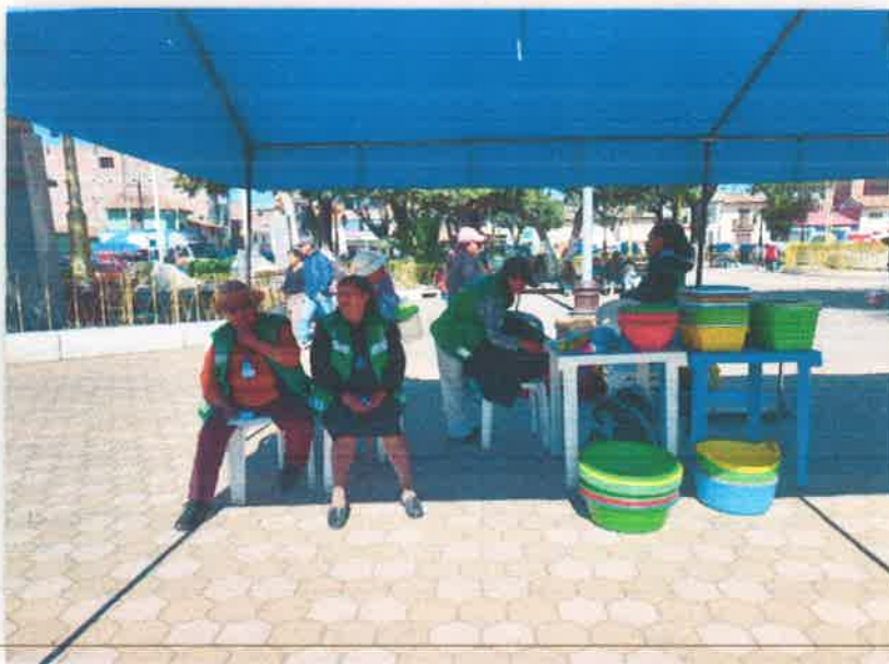
Imagen N° 24 : Fotografía de la participación de las promotoras ambientales comunitarias