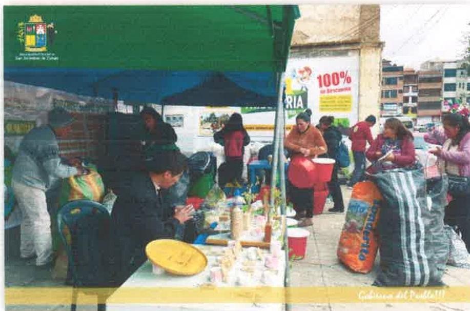
Imagen N° 35 : Fotografía de los participantes, vendiendo sus productos sostenibles.