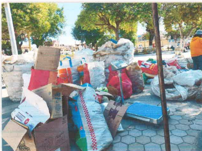
Imagen N° 21 : Fotografía del total de residuos reciclables durante el ECOTRUEQUE