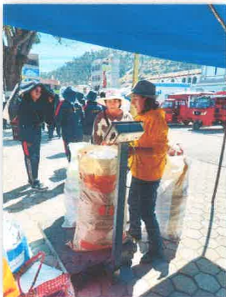
Imagen N° 17 : Fotografía del pesado de los residuos reciclables