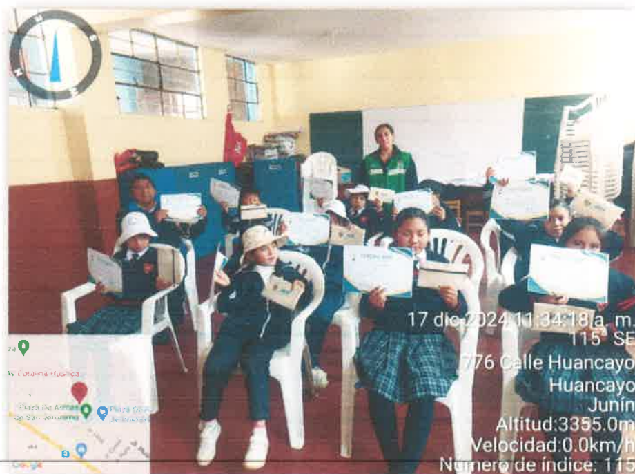
Imagen N° 06: Entrega de certificados - Institución Educativa N° 30244 "Juana Guerra Chávez"