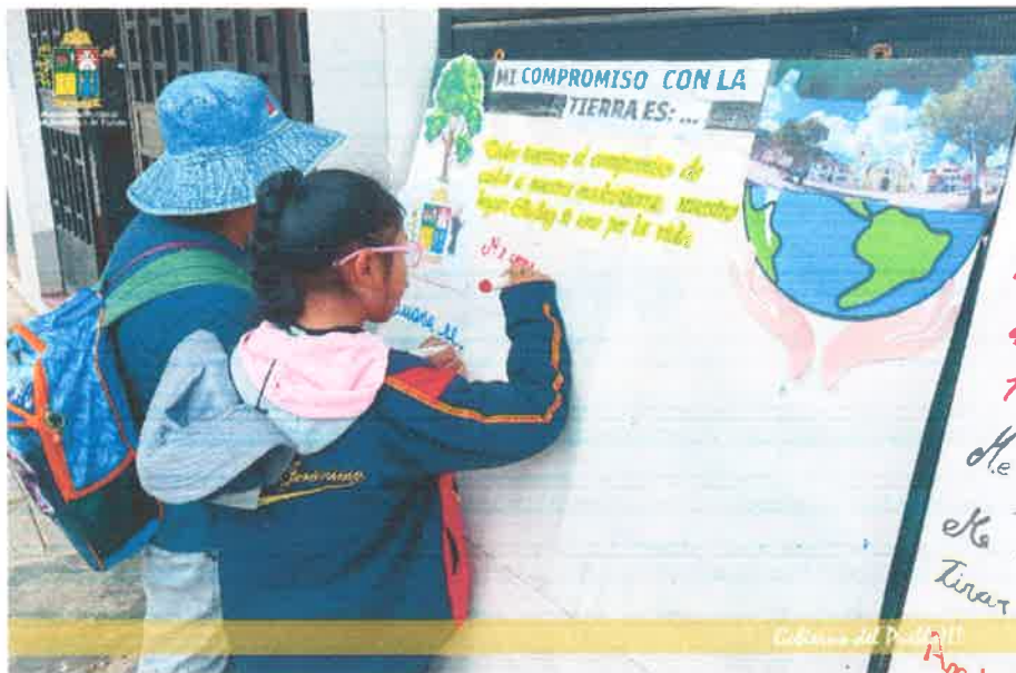
Imagen N° 41 : Fotografía de los compromisos ambientales dejado por los padres y estudiantes de la institución educativa de nuestro Distrito.