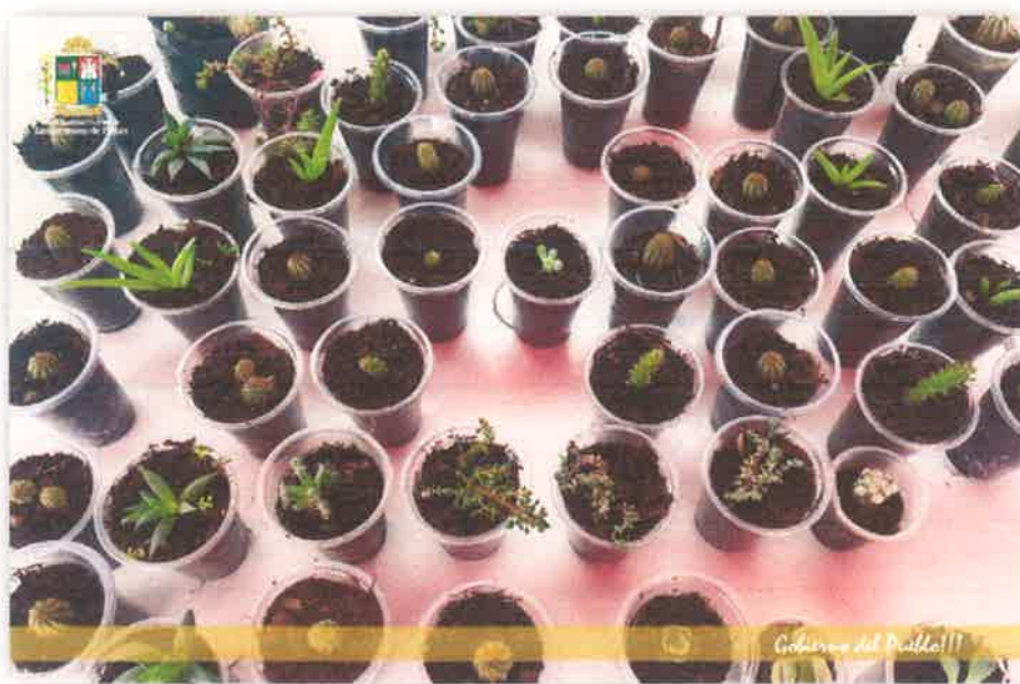
Imagen N° 42 : Fotografía de los incentivos entregados por el Día de la Tierra.