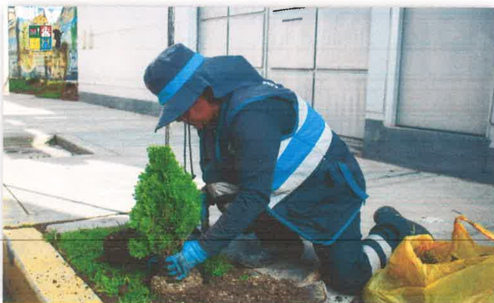
Imagen N° 12 : Fotografía de la plantación de árboles por nuestro personal de limpieza