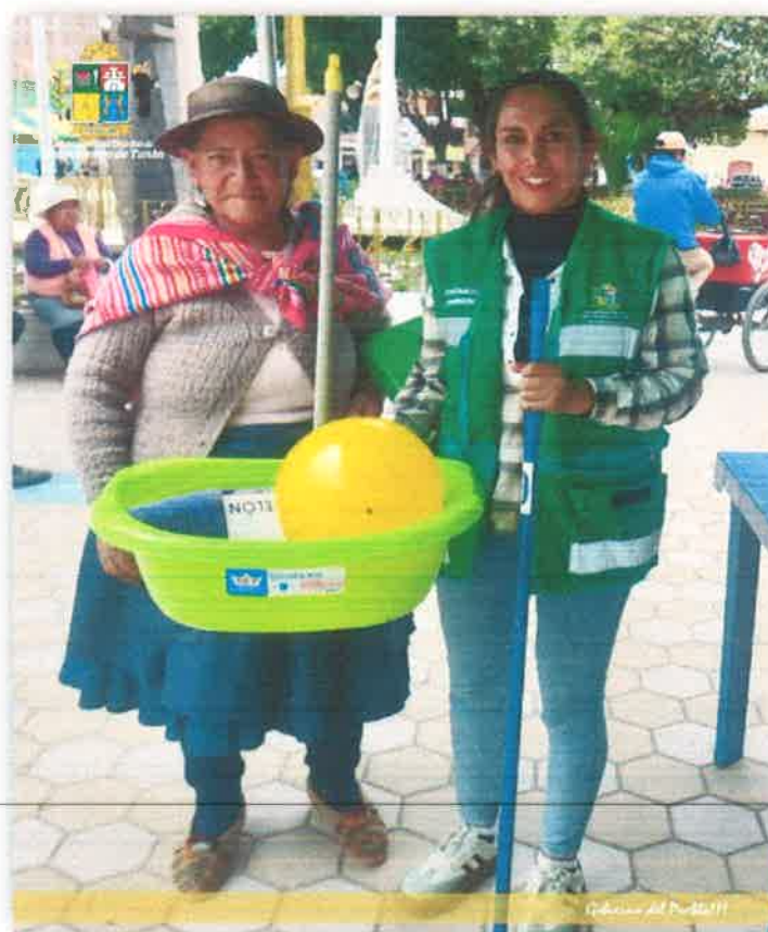
Imagen N° 40 : Entrega de kits de limpieza