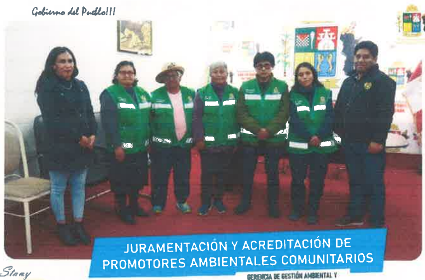
Imagen N° 50 : Fotografía de la juramentación y acreditación de promotores ambientales comunitarios