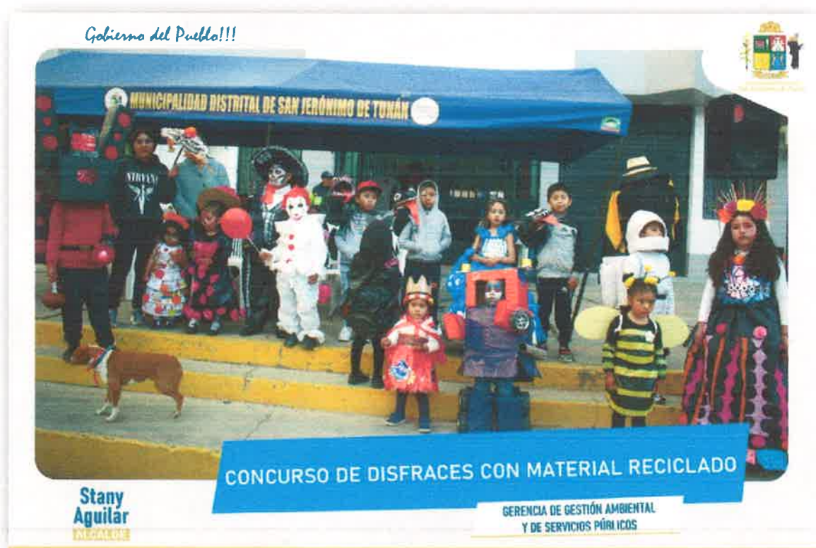
Imagen N° 44 : Fotografía de los participantes del concurso de disfraces con material reciclado.

https://www.facebook.com/story.php?story_fbid=1276748033281490&id=100028389175154&mibextid=qi2Omg&rdid=IUzmZVwL8DhWD1sg