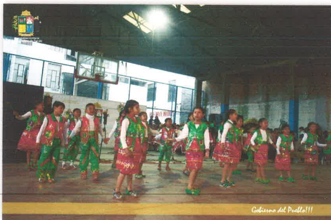
Imagen N° 45 : Fotografía de los participantes del villancico

https://www.facebook.com/story.php?story_fbid=1276748033281490&id=100028389175154&mibextid=qj2Omg&rdid=IUzmZVwL8DhWD1sg