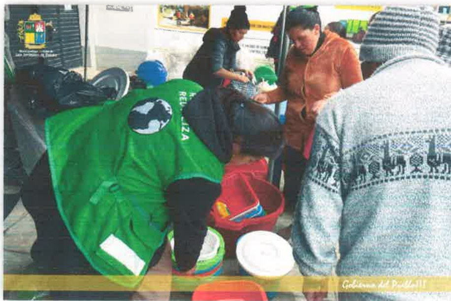
Imagen N° 36 : Fotografía del Ecotrueque con los Promotores Ambientales Juveniles