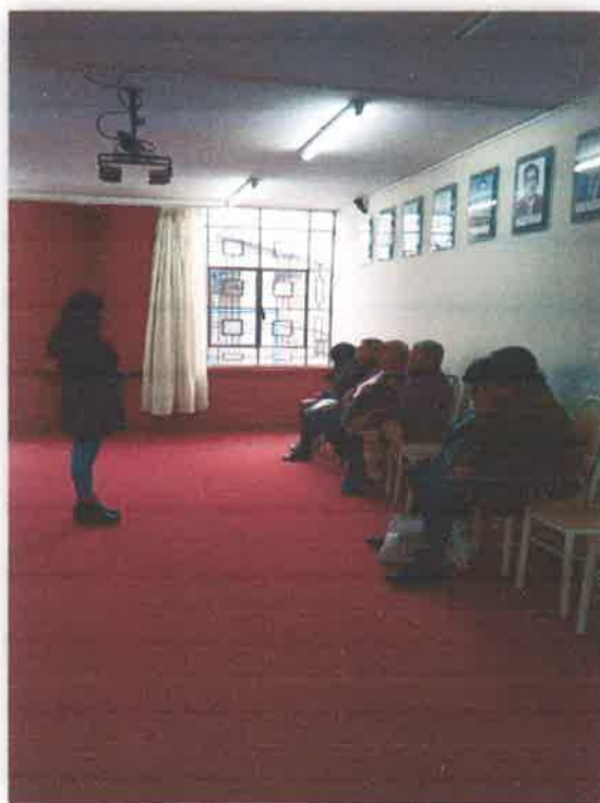
Imagen N° 49 : Fotografía de la capacitación y explicación de las actividades que realizarán los promotores ambientales comunitarios