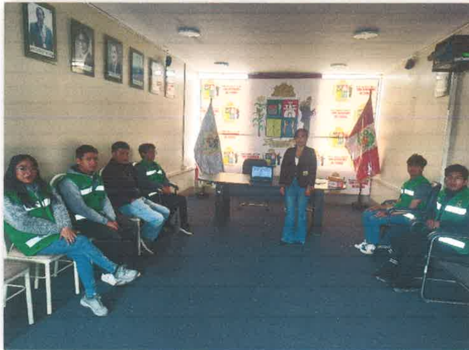
Imagen N° 48 : Capacitación a los Promotores Ambientales Juveniles