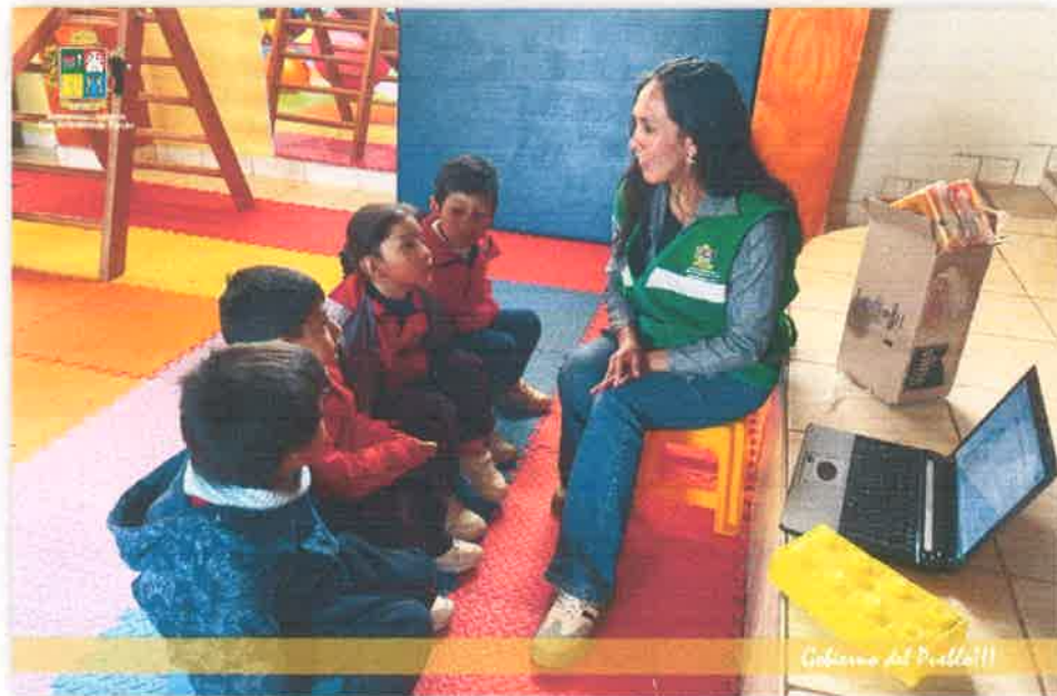
Imagen N° 05: Capacitación a los PAE de la I.E. N° 256 ELIZABETH REVOLO AMPUERO

PROGRAMA MUNICIPAL EDUCCA EDUCACIÓN, CULTURA Y CIUDADANÍA AMBIENTAL