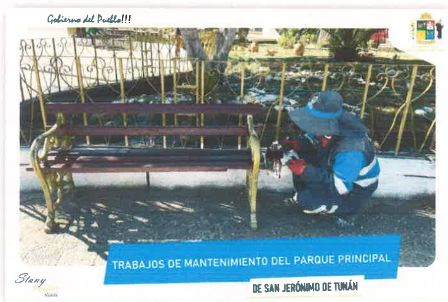
Imagen N° 30 : Fotografía del pintado de las bancas del Parque 28 de Julio por la Unidad de Limpieza Pública