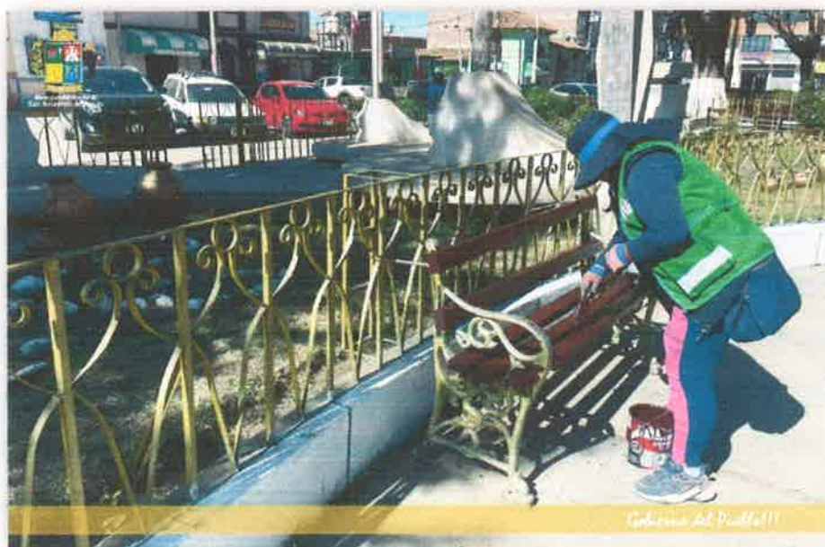
Imagen N° 31 : Fotografía del pintado de las bancas del Parque 28 de Julio por los Promotores Ambientales Comunitarios

PROGRAMA MUNICIPAL EDUCCA EDUCACION, CULTURA Y CIUDADANIA AMBIENTAL