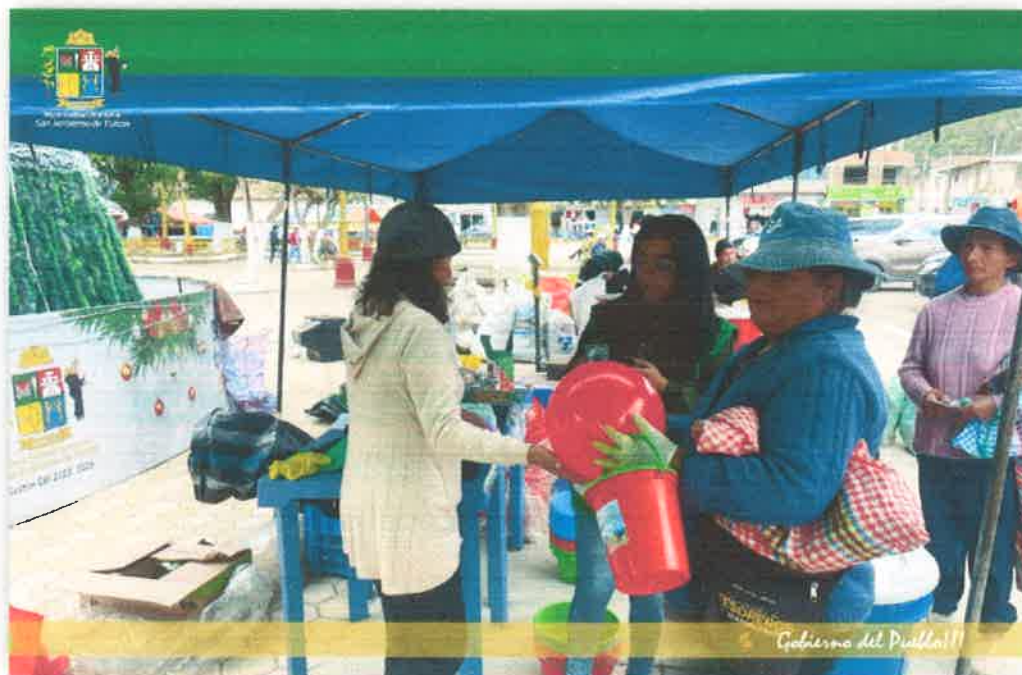
Imagen N° 39 : Fotografía del Intercambio de productos por sus residuos reciclables.