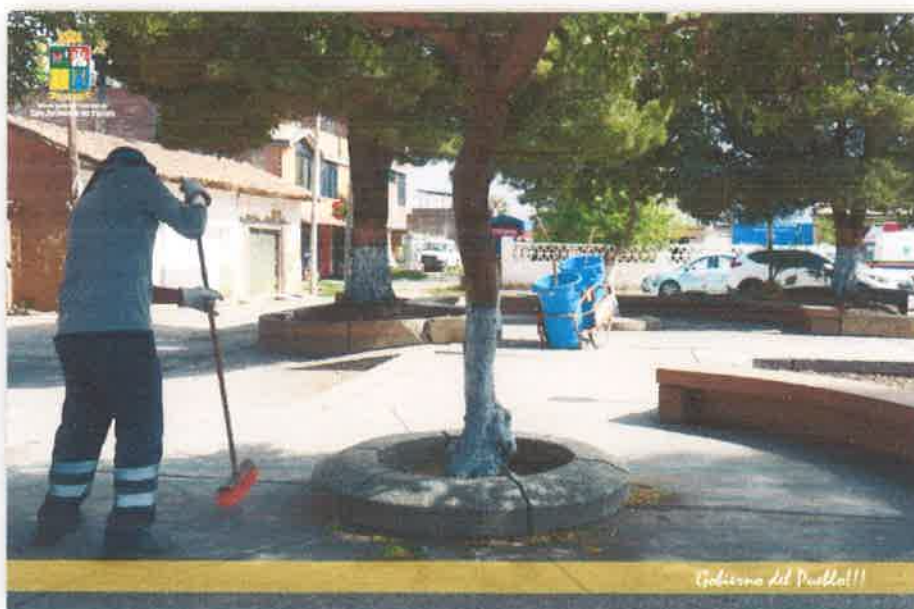
Imagen N° 33 : Fotografía de la limpieza de Hojarascas del Parque Amoroso por el Personal de Limpieza Pública