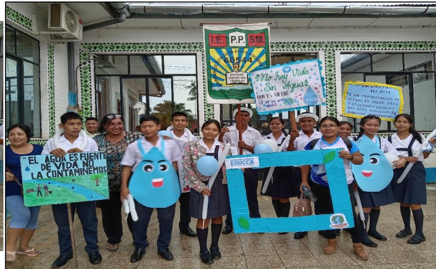
FOTO N° 001: PASACALLE POR EL "DÍA MUNDIAL DEL AGUA"