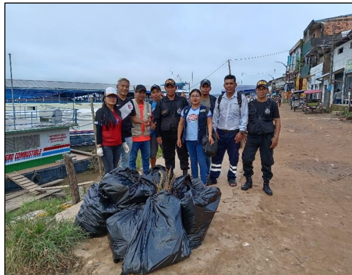
FOTO N° 005: RECOLECCION DE RESIDUOS SOLIDOS POR EL "DIA MUNDIAL DEL MEDIO AMBIENTE"