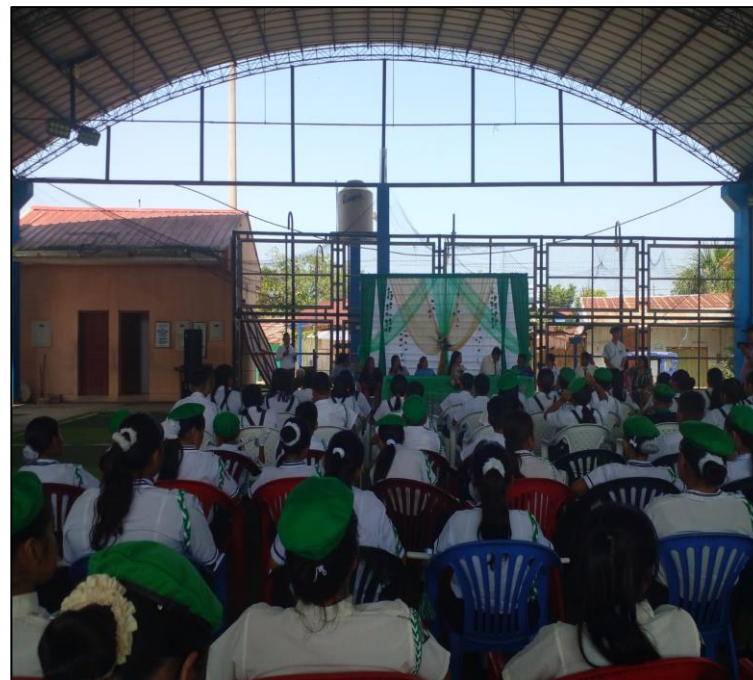
FOTO N°003: JURAMENTACION DE LOS PROMOTORES AMBIENTALES ESCOLARES (PAE) PROMOTORES AMBIENTALES JUVENILES (PAJ) Y PROMOTORES AMBIENTALES COMUNITARIOS (PAC) PERTENECIENTE AL PROGRAMA MUNICIPAL EDUCCA-2024.