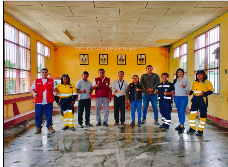
FOTO N°001: ENTREGA DE PLANTONES Y ABONO A LAS PROMOTORAS AMBIENTALES COMUNITARIAS.