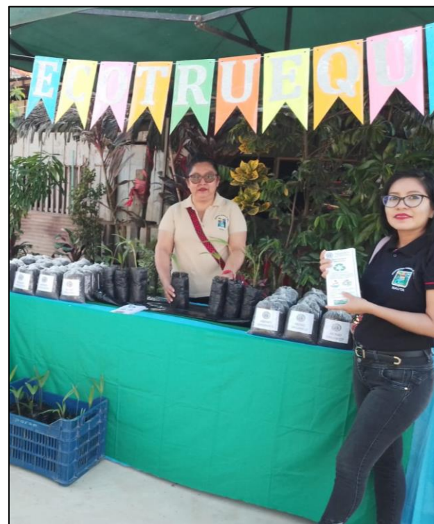
FOTO N°006: ECOTUEQUE POR EL DIA DE LA GESTION INTEGRAL DE LOS RESIDUOS SOLIDOS -DIASOL.