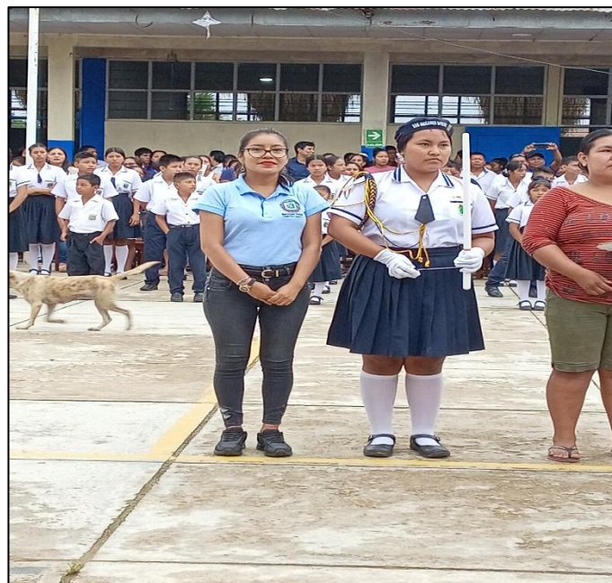
FOTO N°001: RECONOCIMIENTO Y JURAMENTACION DE LOS PROMOTORES AMBIENTALES ESCOLARES (PAE)