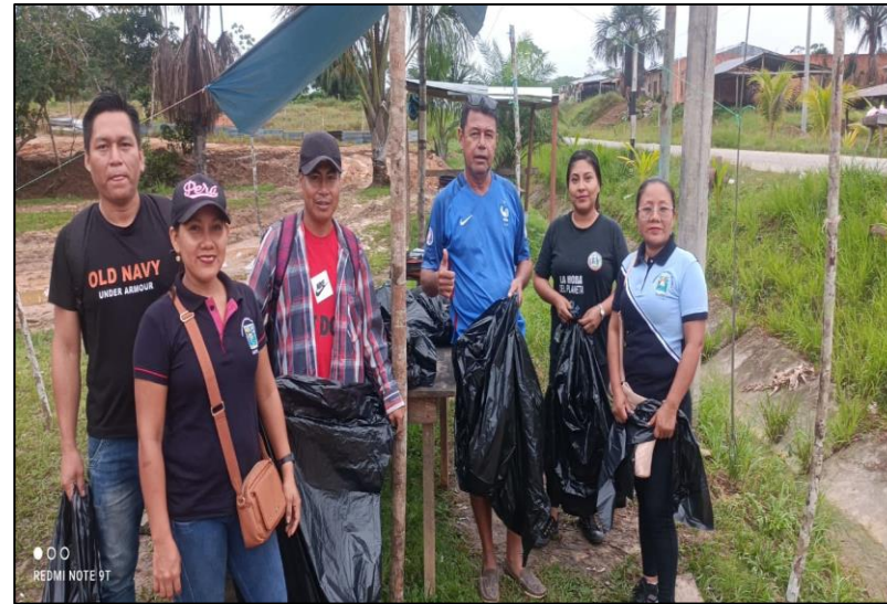
FOTO N°007: LIMPIEZA POR EL DIA DE INTERNACIONAL DE LA LIMPIEZA DE LAS PLAYAS.