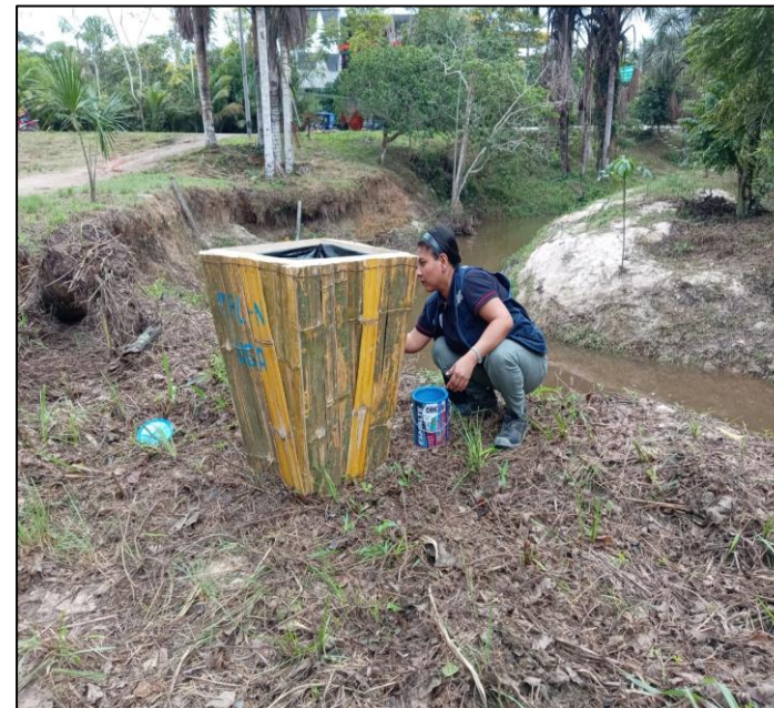
FOTO N°008: RECUPERACION E IMPLEMTACION DE CARTELES Y TACHOS ECOLOGICOS.