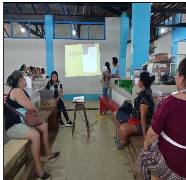
FOTO N°002: CAPACITACION PROMOTORAS AMBIENTALES COMUNITARIAS. HORA: 11:00 A.M LUGAR: MERCADO DE ABASTO.