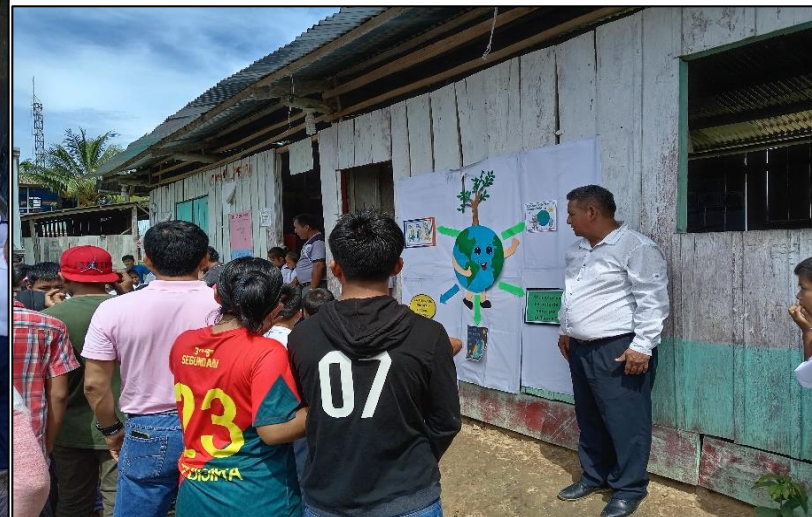
FOTO N° 002: EXCIBICION Y EXPOSICION POR EL "DÍA MUNDIAL DE LA TIERRA"