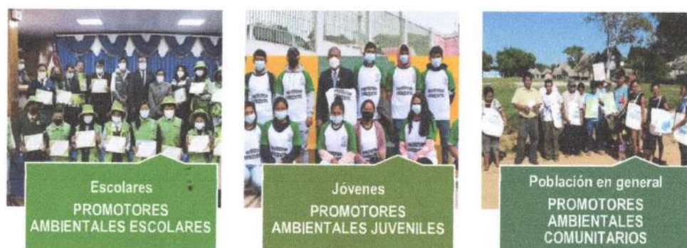
Figura 2. Público objetivo del distrito de Guadalupe.

El Programa Municipal EDUCCA Guadalupe, cuenta con la siguiente población objetiva: