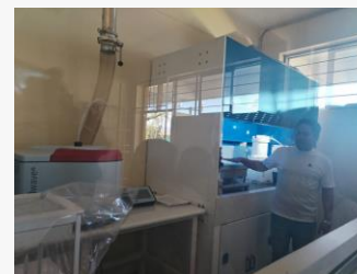
ACCIONES PARA PROTOTIPO