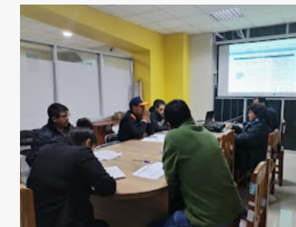
ACCIONES PARA CONDICIONES DE HABITABILIDAD