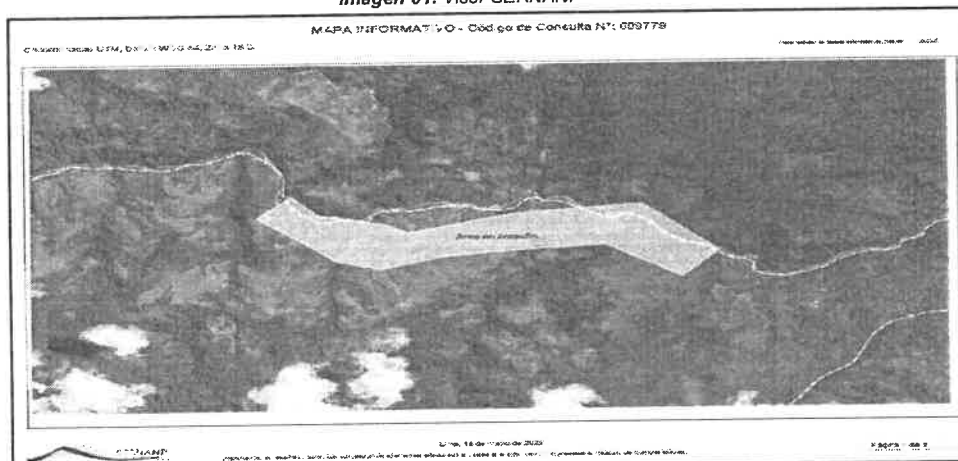
Imagen 01. Visor SERNANP