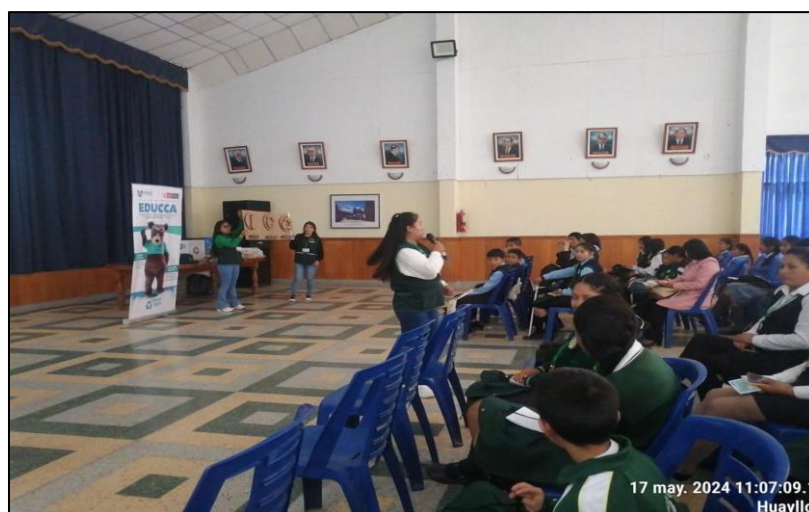
Imagen 01: Charla informativa en Acreditación de Promotores ambientales escolares PAES – Yungay 2024