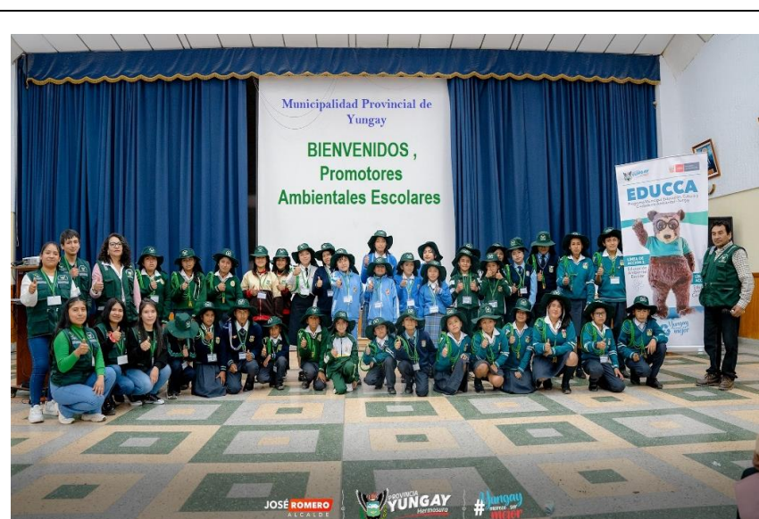
Imagen 01: Acreditación de Promotores ambientales escolares PAES – Yungay 2024