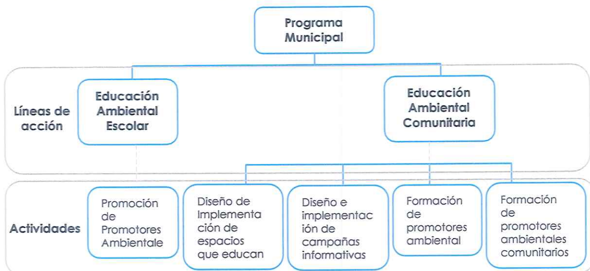
Gráfico 1: Líneas de Acción y Actividades del Programa EDUCCA del Distrito de Moche

dispositivos legales relacionados al programa, presenta el Plan de Trabajo 2025 del Programa Municipal de Educación, Cultura y Ciudadanía Ambiental del Distrito de Moche, como herramienta de gestión indispensable para la ejecución de las actividades de educación, cultura y ciudadanía ambiental.