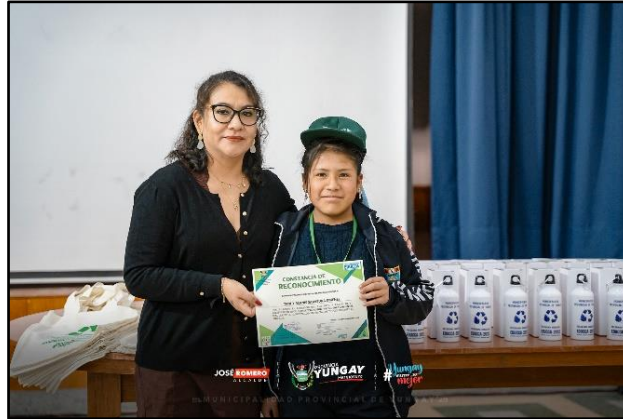
Imagen 01: Reconocimiento al PAE