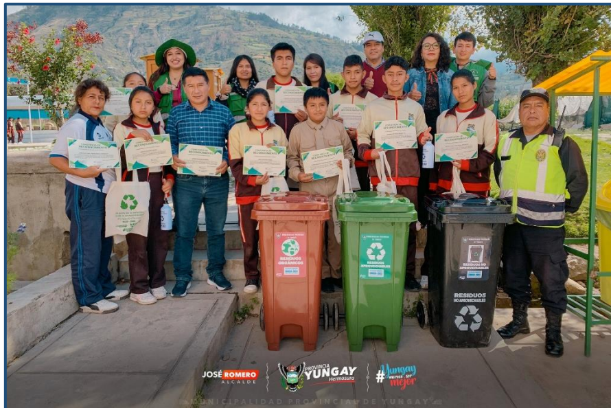
Imagen 02: Entrega de incentivos y Constancias a PAEs.