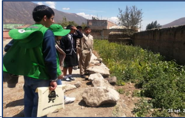
Proyecto 01: Bio “Huerto ecológico” I.E.P.- “Ignacio Amadeo Ramos Olivera”

3 proyectos educativos ambientales implementados por los PAE y docentes en las Instituciones Educativas participantes del programa municipal EDUCCA 2023 – Yungay