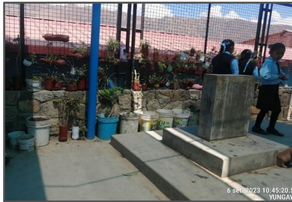
Proyecto 02: de “jardín colgante” I.E.P.- “Ignacio Amadeo Ramos Olivera”