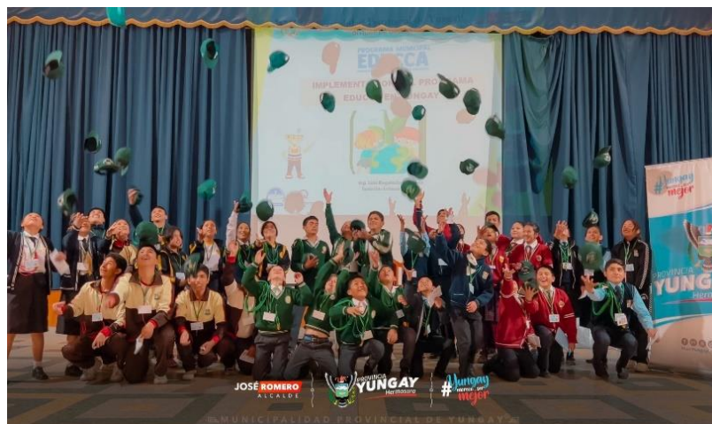
Imagen 02: Acreditacion de a PAE 2023