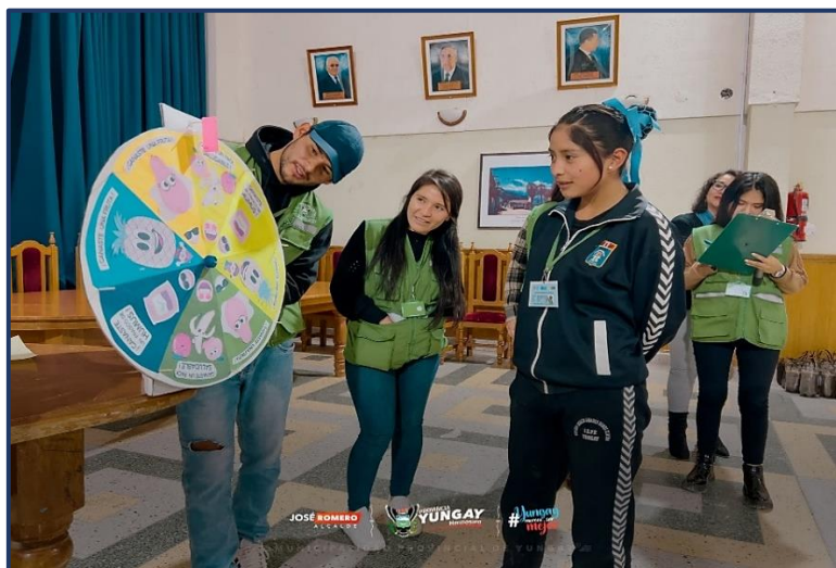
Imagen 02: Juegos interactivos en segunda Capacitacion a PAE