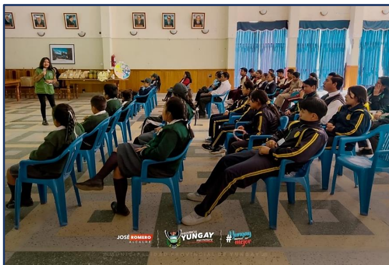
Imagen 01: Sala de segunda Capacitacion a PAE