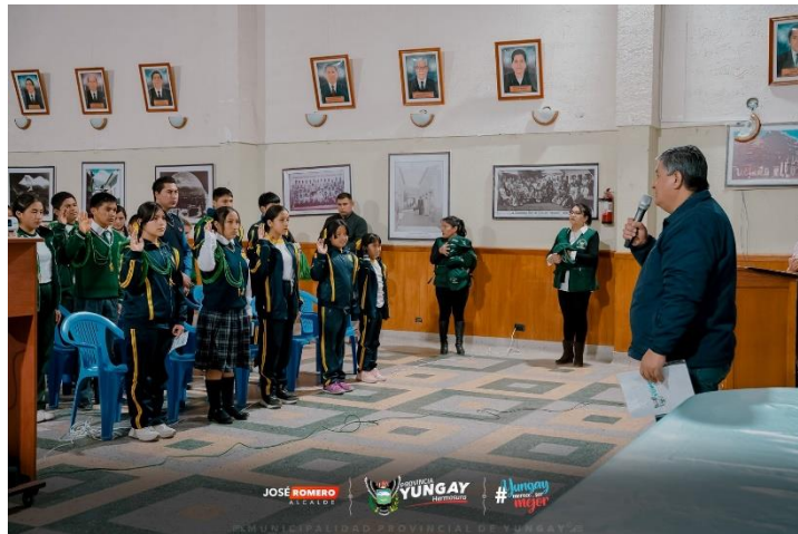
Imagen 01: Juramentacion por el Alcalde PROVINCIAL de Yungay de a PAE 2023