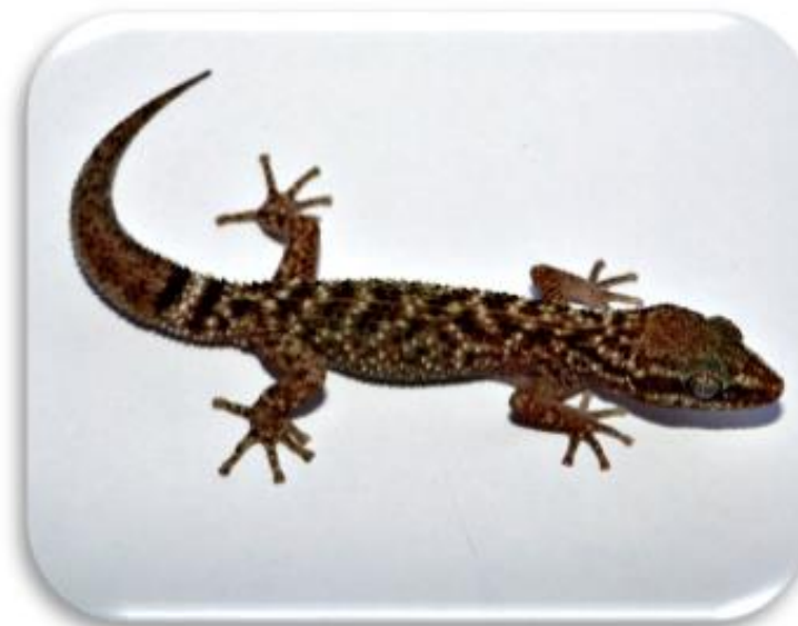
Phyllodactylus sp. "Gecko"