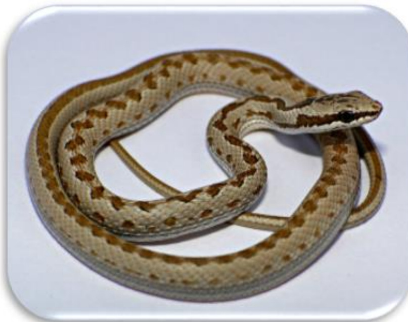
Pseudalsophis elegans "Serpiente costeña"