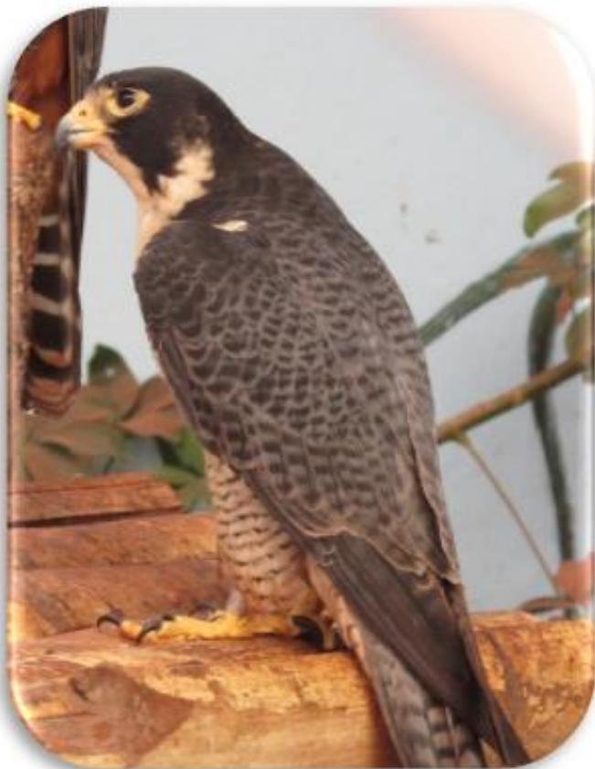
Falco peregrinus “Halcón peregrino”