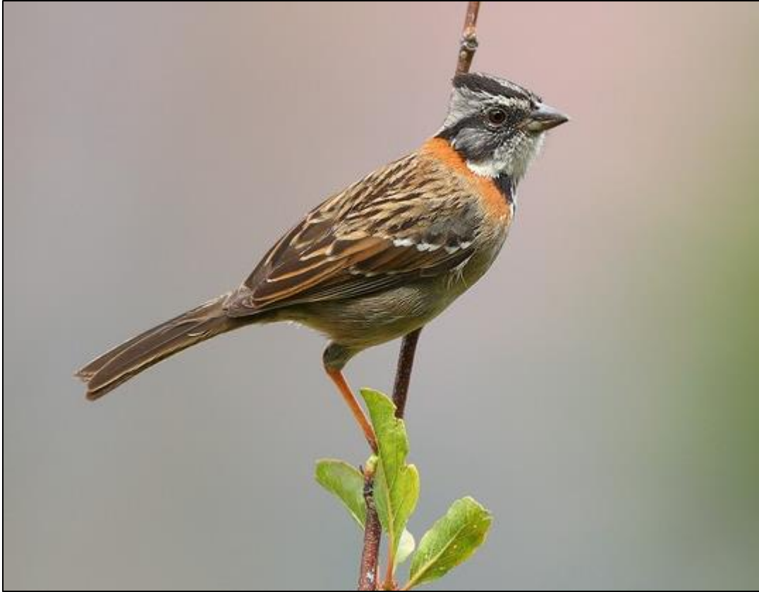
Gorrión americano ( Zonotrichia capensis )