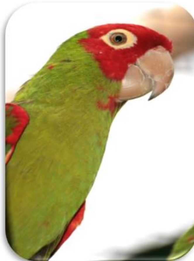
Psitacara erythrogenys “Loro cabeza roja”