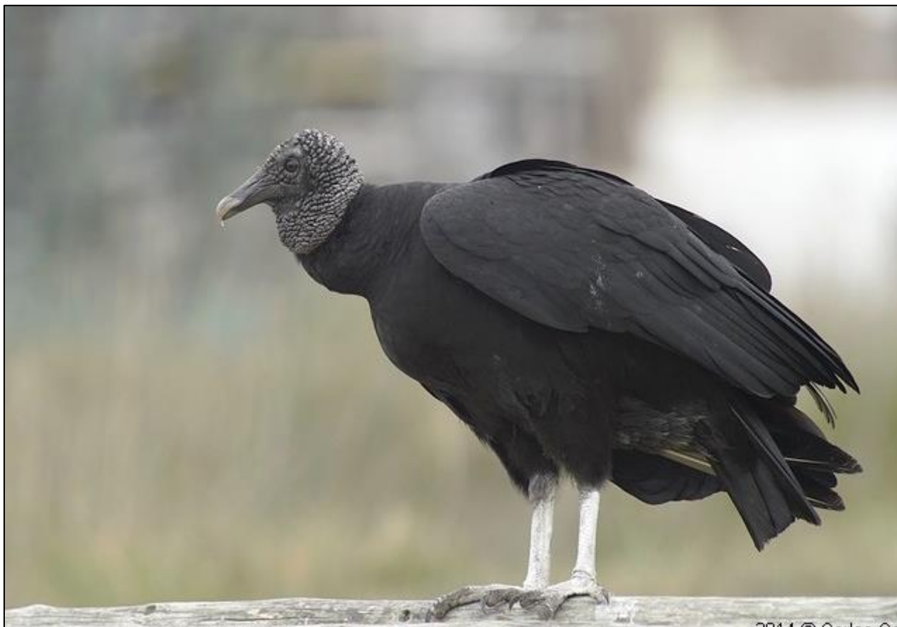
Gallinazo negro ( Coragyps atratus )