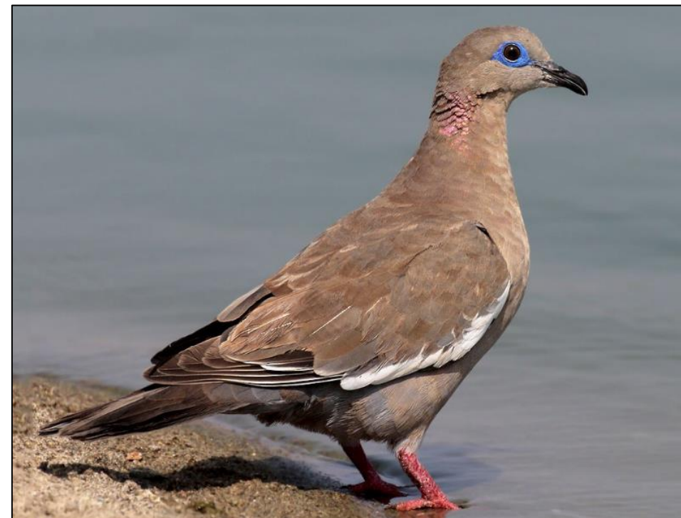
Tortola o Cuculi ( Zenaida meloda )