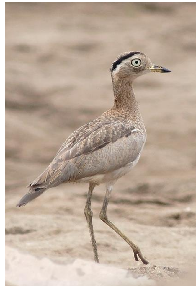
Huerequeque ( Burhinus superciliaris )