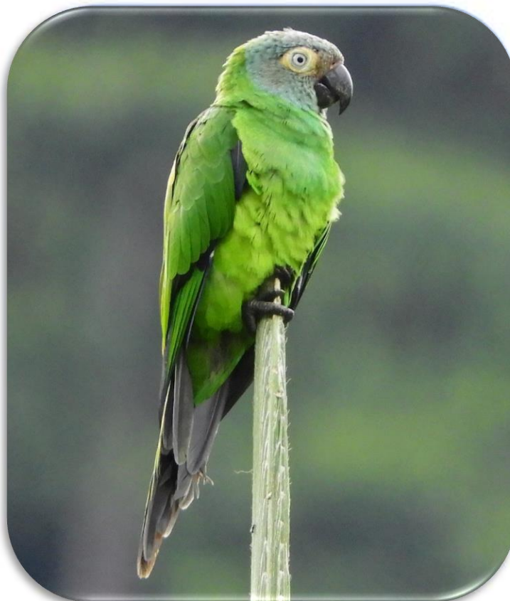
Aratinga weddelli Loro cabeza negra