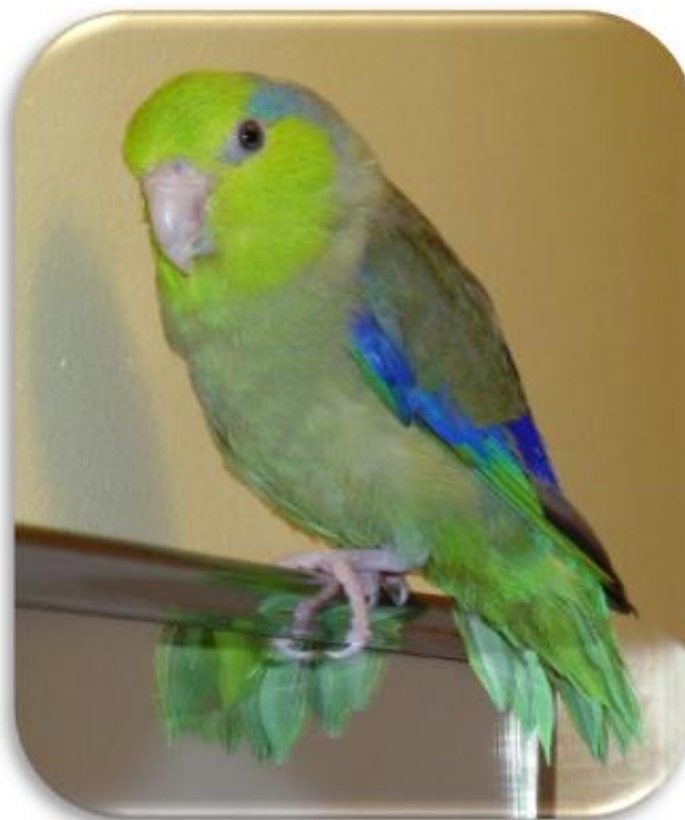
Forpus coelestis “Perico esmeralda”