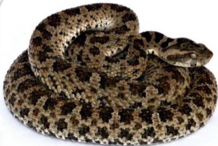
Bothrops pictus "Serpiente"