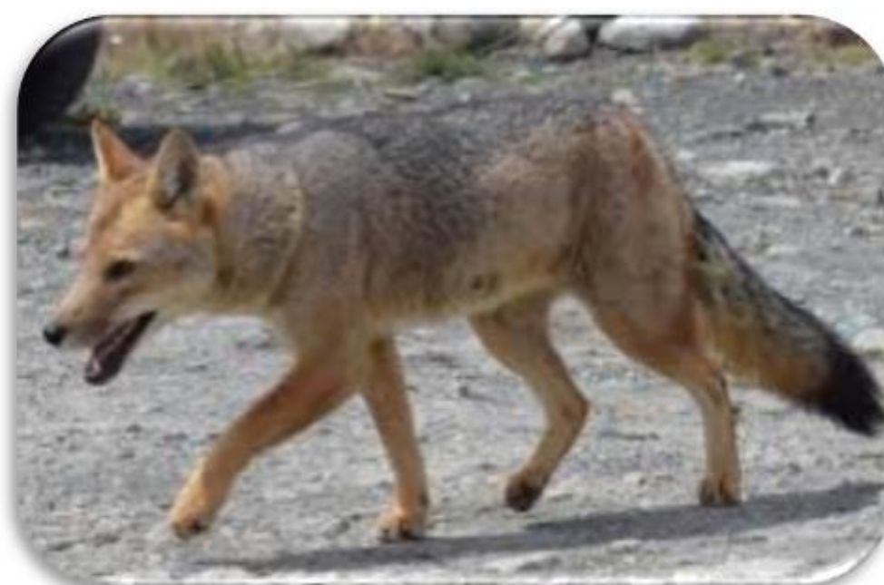
Lycalopex culpaeus “Zorro andino”