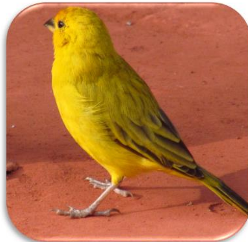
Sicalis flaveola “Botón de oro”