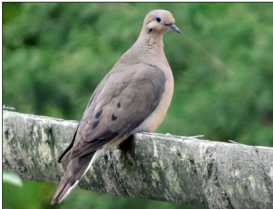
Tórtola orejuda ( Zenaida auriculata )