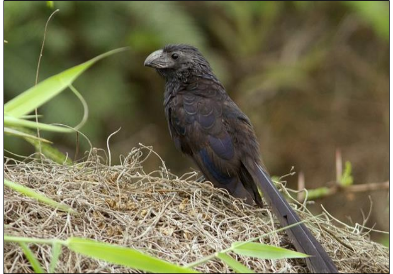
Guardacaballo ( Crotophaga sulcirostris )