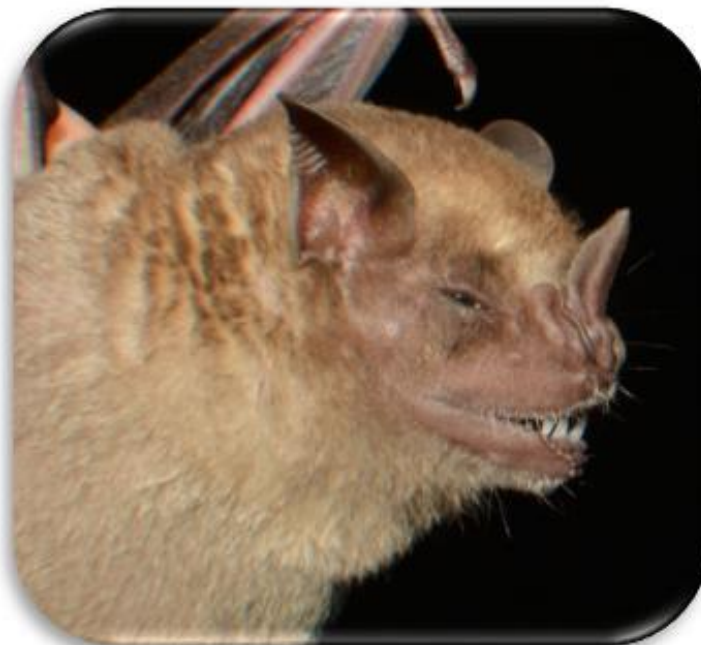
Artibeus fraterculus “Murciélago frutero”