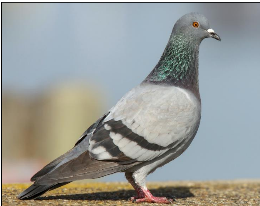
Paloma doméstica ( Columba livia )