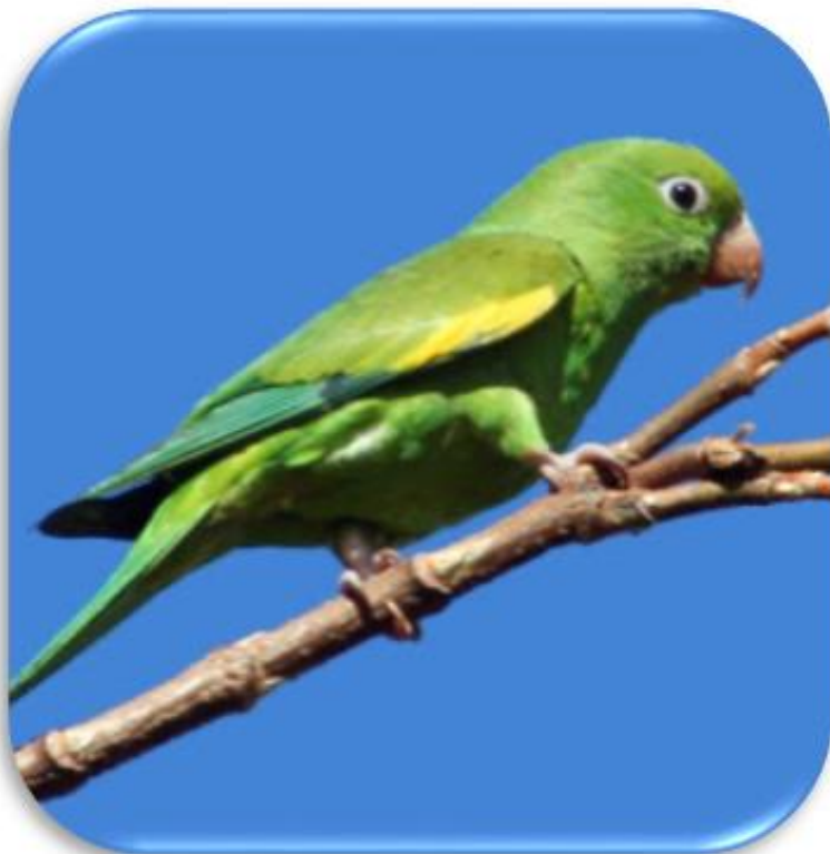
Brotoogeris versicolorus “ Pihuichos ala amarilla ”