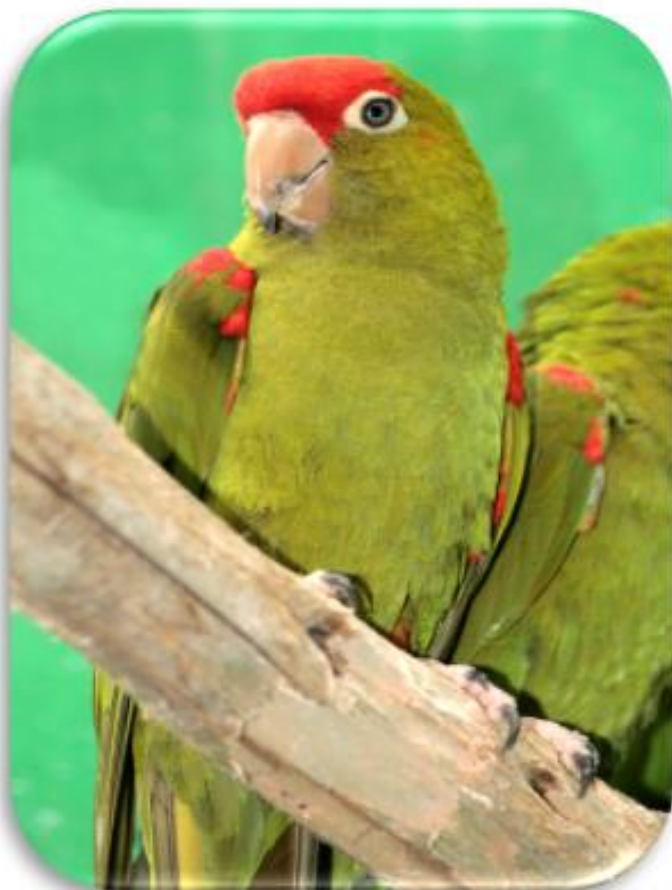
Psitacara wagleri “Loro frente roja”