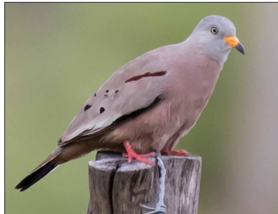
Tortolita peruana ( Columbina cruziana )