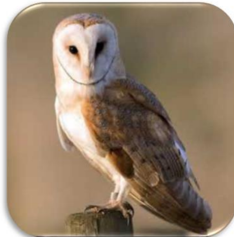
Tyto alba “Lechuza de campanario”