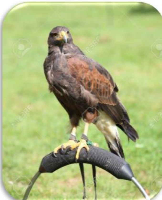
Parabuteo unicinctus “Gavilán acanelado”