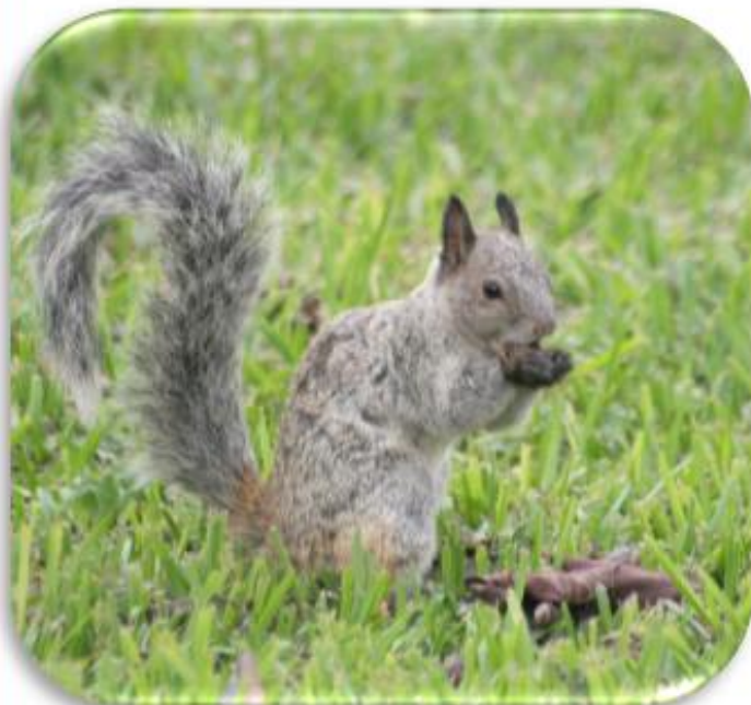
Sciurus stramineus “Ardilla nuca blanca”

SERFOR Servicio Nacional Forestal y de Fauna Silvestre