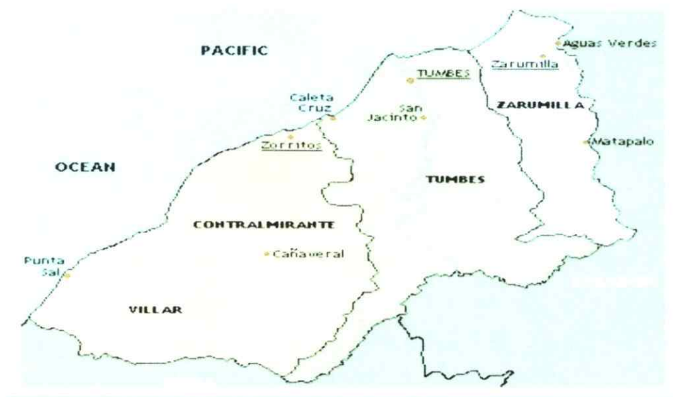
Figura 1: Mapa de Ubicación de la Provincia de Contralmirante Villar