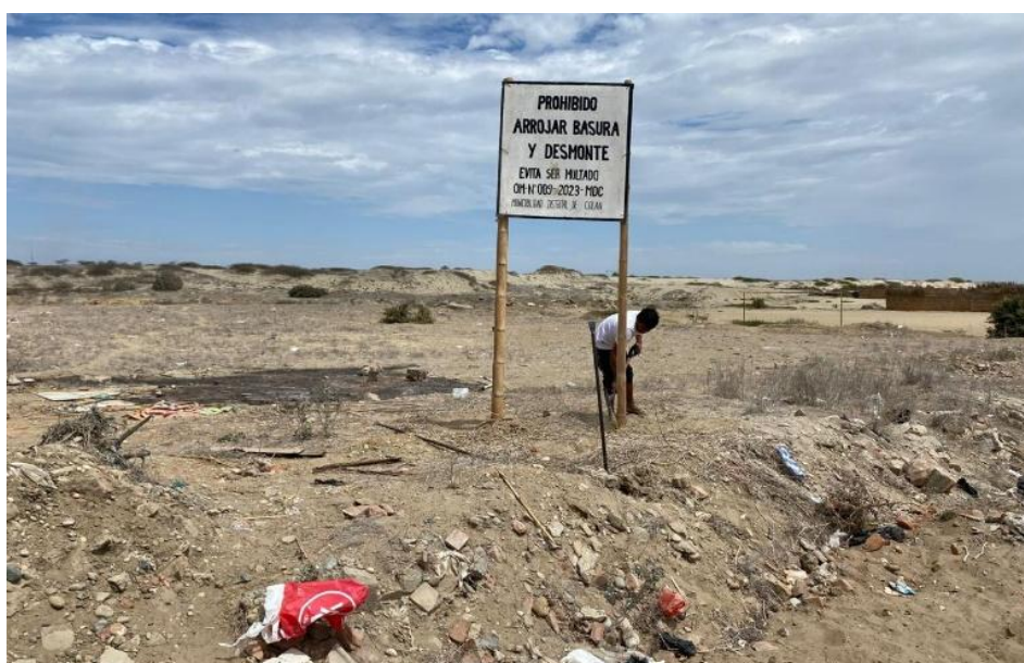
Instalación de cartel en pueblo nuevo de calan parte alta en paralelo con el cementerio municipal.