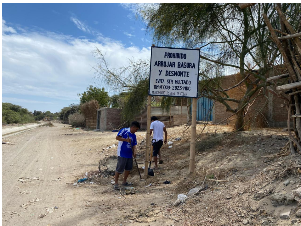
Instalación de cartel en el camino hacia el sector la peña.