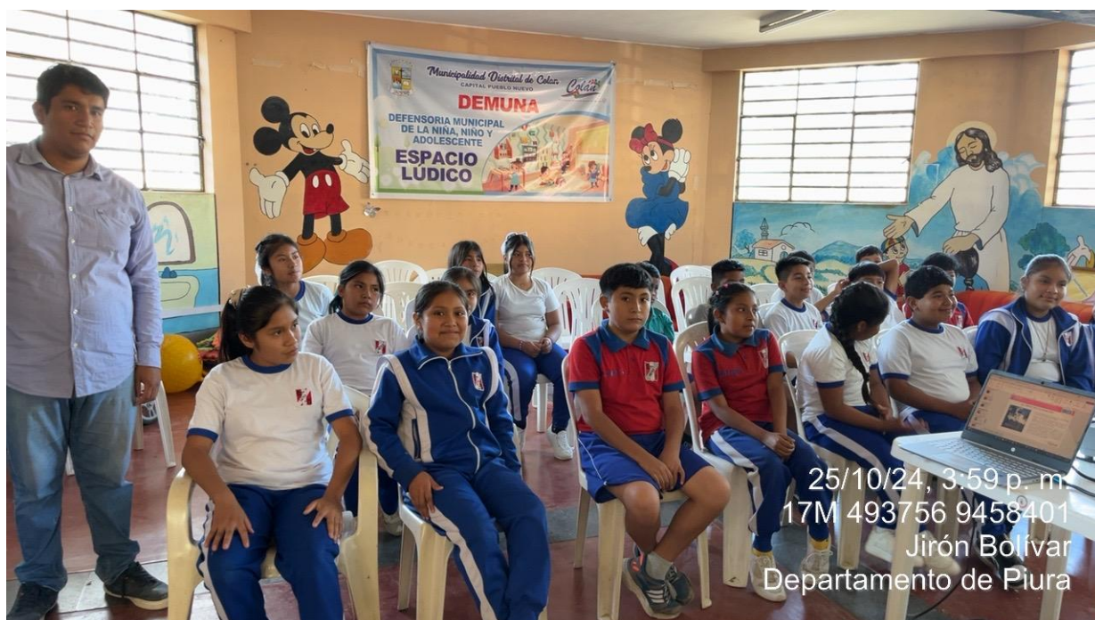
Charla acerca de los residuos sólidos y su buena Gestión, I.E 14752 Gilberto Jacinto Palacios Talledo.

25/10/24, 3:59 p. m. 17M 493756 9458401 Jirón Bolívar Departamento de Piura