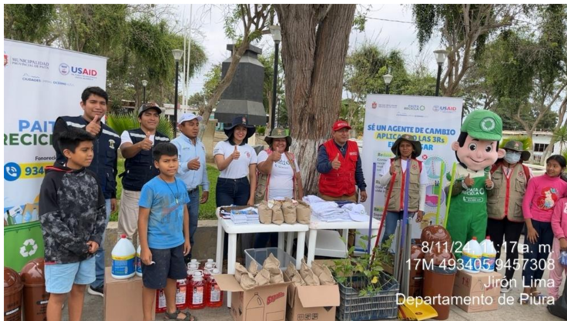
Realización de actividades: “RECICLATON” junto con la participación de la Municipalidad Provincial de Paíta.