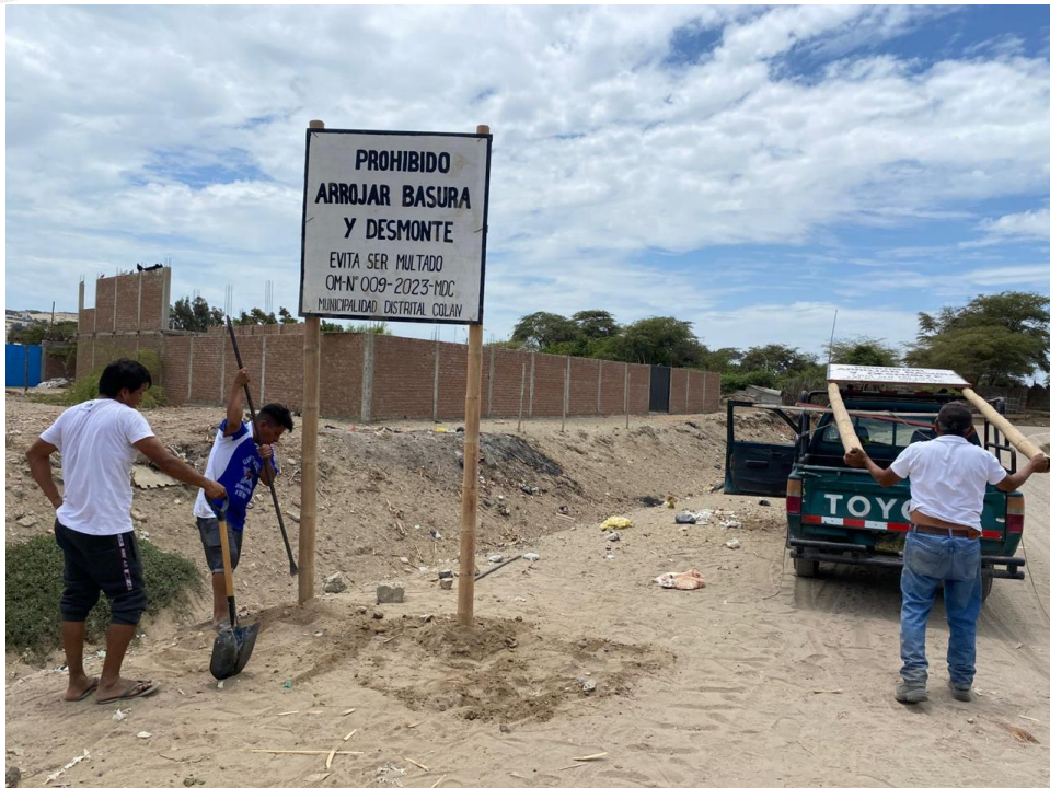
Instalación de cartel en el inicio de dren colector 01.