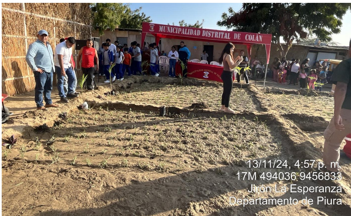
Se realizó la actividad de inauguración e inicio de las actividades en la habilitación de áreas verdes y un ECOPARQUE en el AAHH “Nuevo Porvenir”