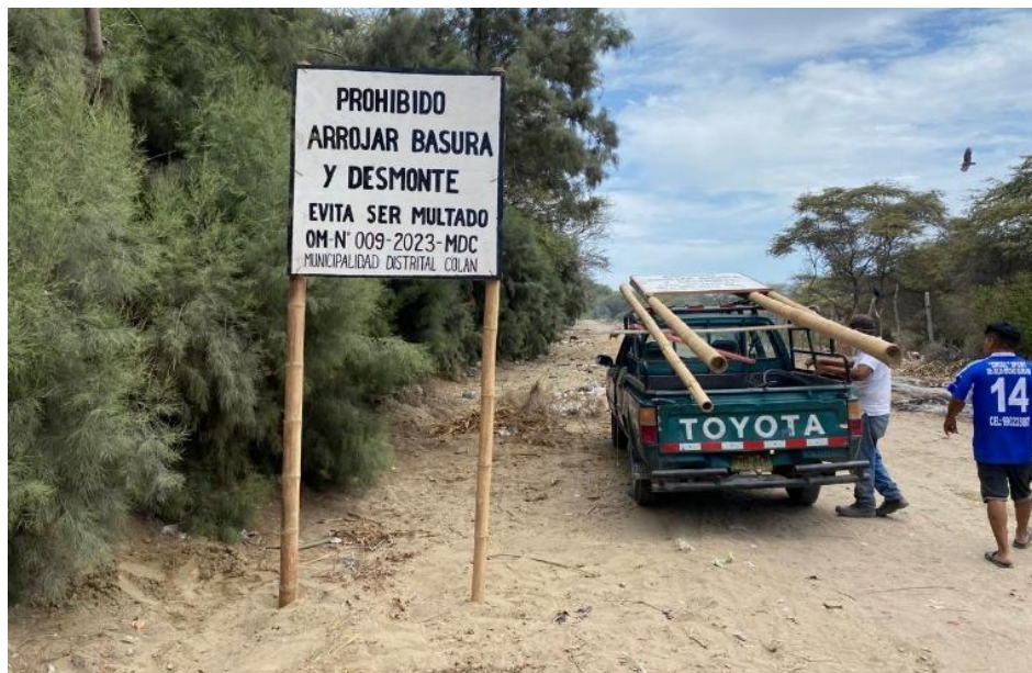
Instalación de cartel en camino hacia las lagunas de oxidación.