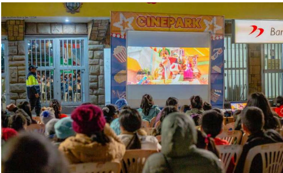
Ilustración 9 Proyección de Mario Bross 21/07/2023

CINEPARK: En este evento, los participantes tendrán la oportunidad de disfrutar de una experiencia de cine única al intercambiar productos reciclables por entradas de cine. Los productos reciclables incluyen papel, cartón, vidrio, plástico, y serán canjeados por entradas de cine y una bolsita de canchita de porcorn para una película que se proyectará en nuestro: