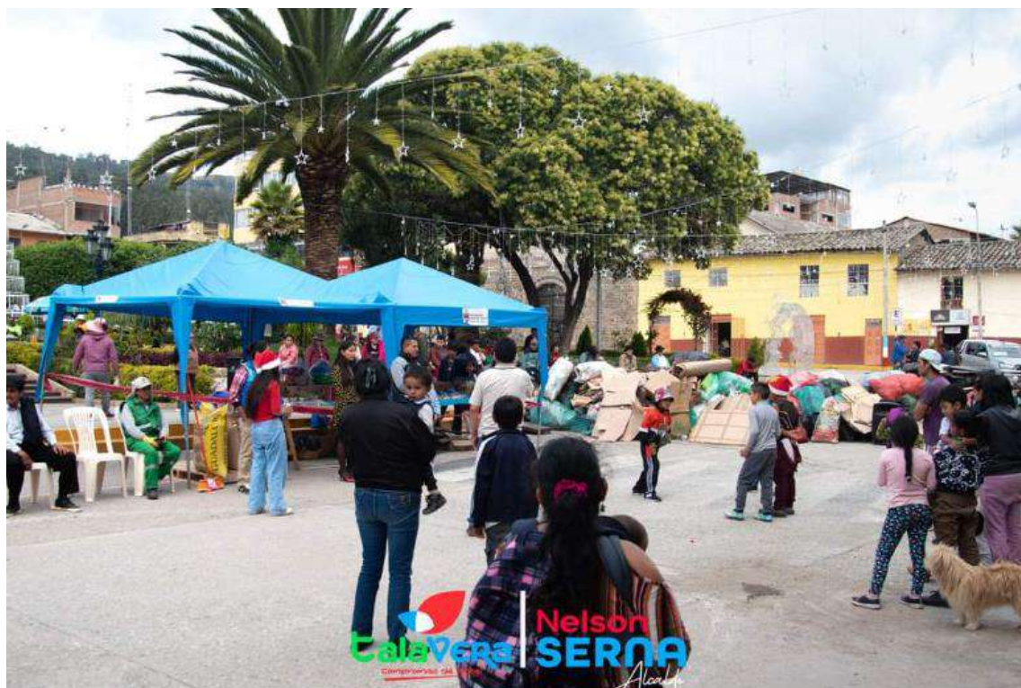
Ilustración 18 Clausura de la Ecotienda

PROGRAMA MUNICIPAL EDUCCA EDUCACIÓN, CULTURA Y CIUDADANÍA AMBIENTAL