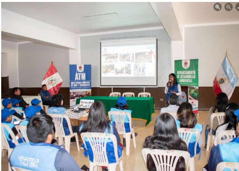
Ilustración 1 Conformación de Ecovoluntarios