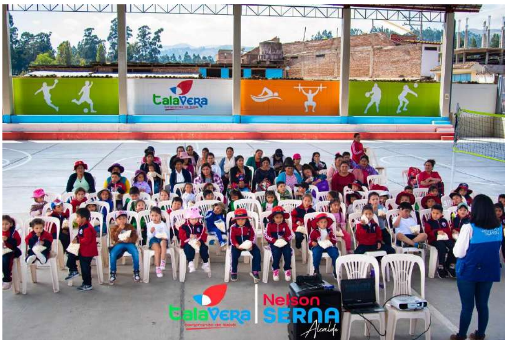
Ilustración 3 Capacitación en temas de Segregación de Residuos Solidos

COMUNIDADES DE MULACANCHA, CHUMBIBAMBA, CHIHUAMPATA, SANTA ROSA Y CASACANCHA