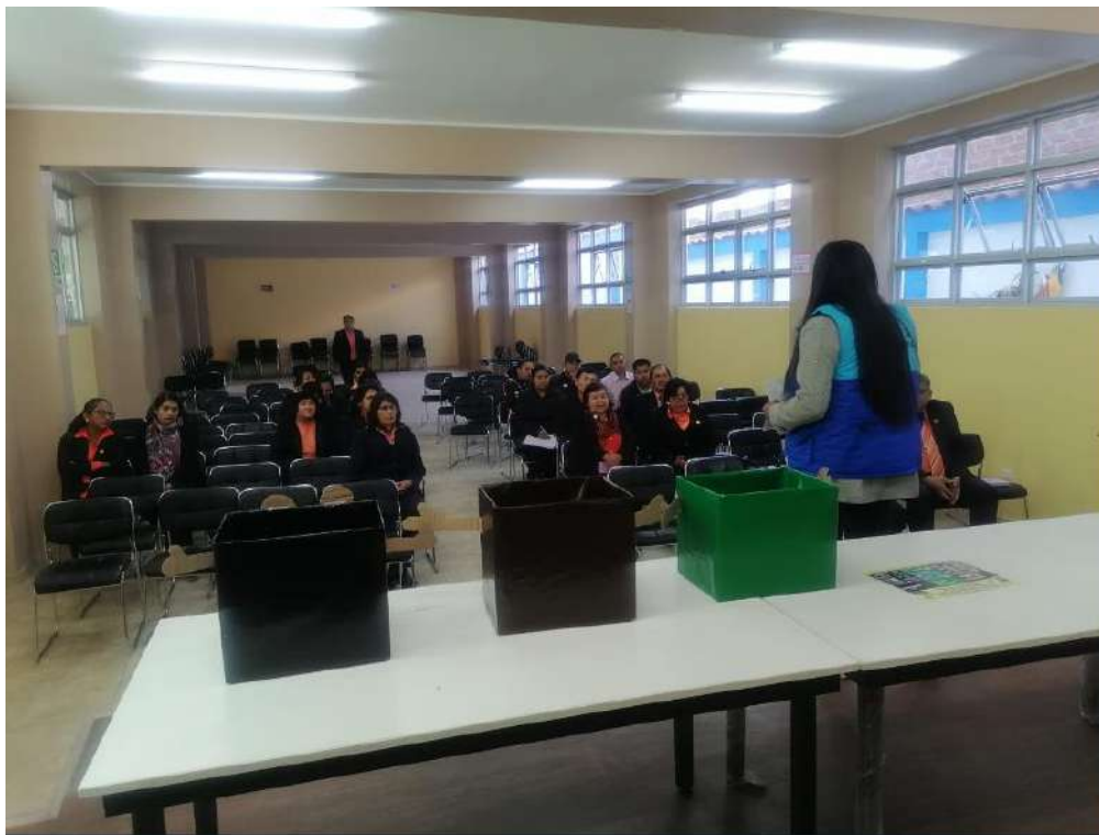
Ilustración 5 Capacitación a los Alumnos del nivel primario de la Institución Educativa Buen Pastor en tema de Residuos Solidos