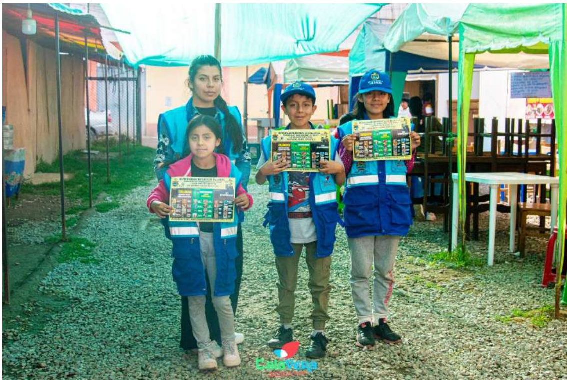
Ilustración 12 Sensibilización a establecimientos comerciales

PROGRAMA MUNICIPAL EDUCCA EDUCACIÓN, CULTURA Y CIUDADANÍA AMBIENTAL