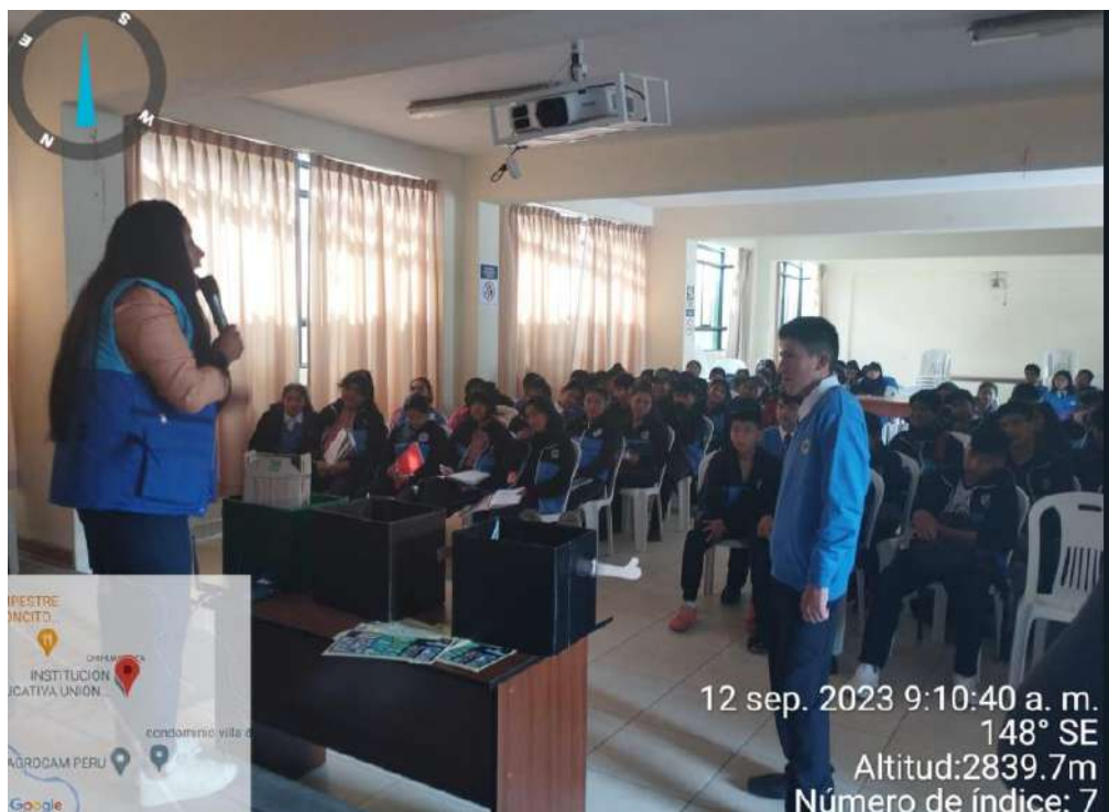
Ilustración 3 Capacitación en temas de Residuos Sólidos en el Colegio Unión Pacifico del Sur

PROGRAMA MUNICIPAL EDUCCA EDUCACIÓN, CULTURA Y CIUDADANÍA AMBIENTAL