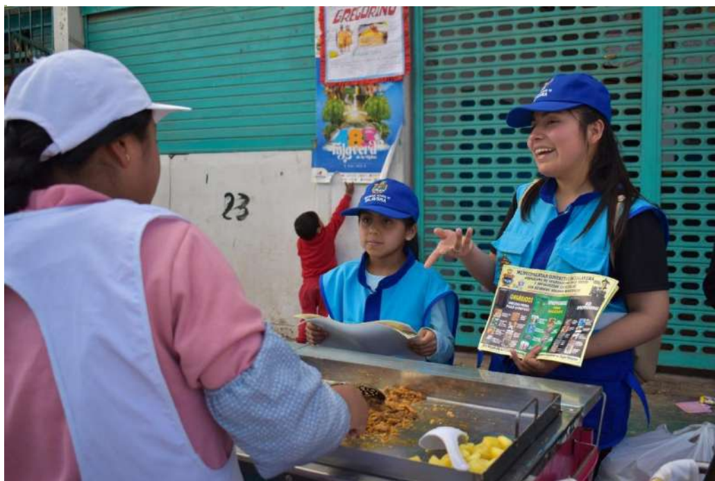
Ilustración 10 Campaña de Sensibilización en Segregación de Residuos Sólidos en el Mercado de Talavera

PROGRAMA MUNICIPAL EDUCCA EDUCACIÓN, CULTURA Y CIUDADANÍA AMBIENTAL