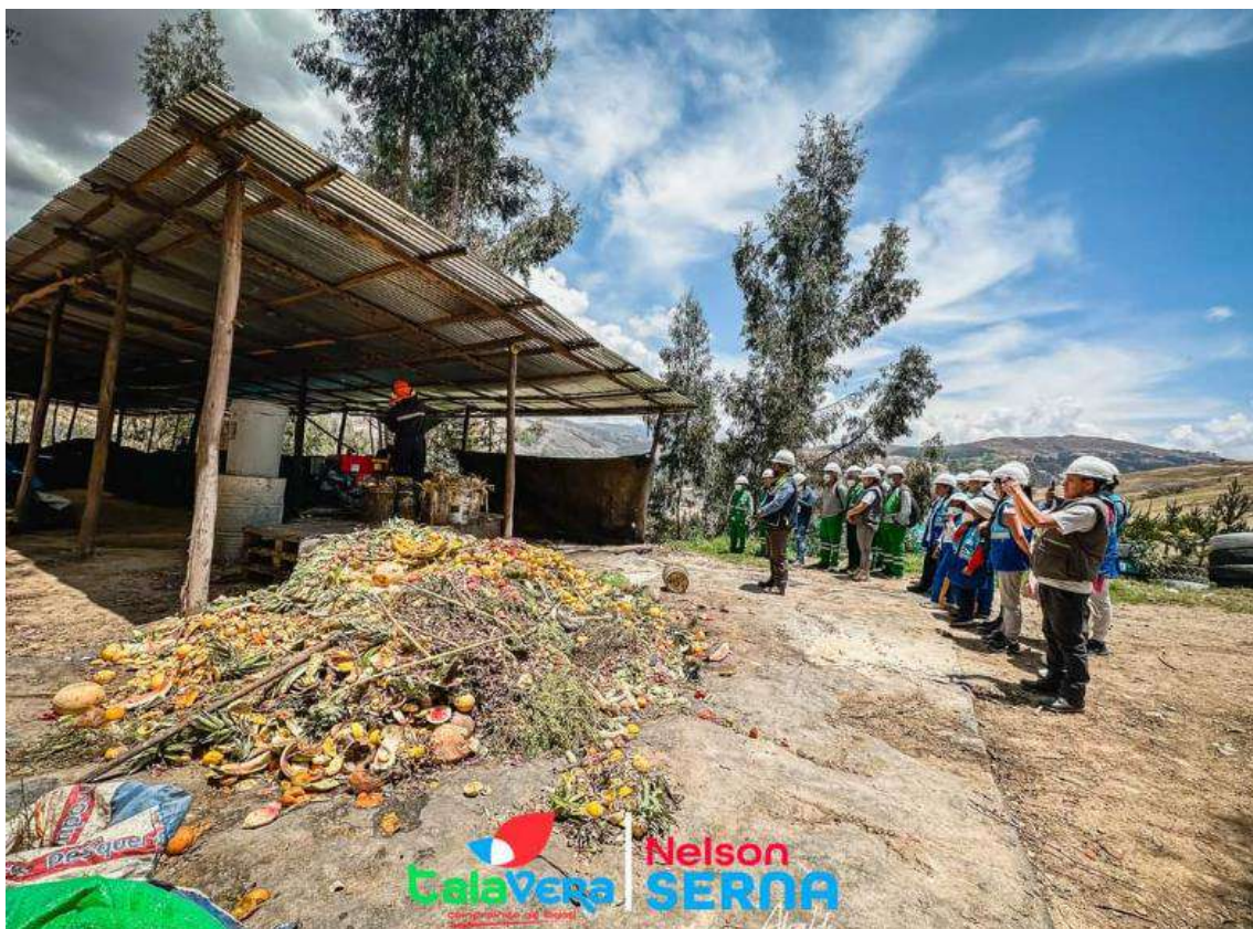
Ilustración 17 Clausura del Programa de Ecovoluntariado