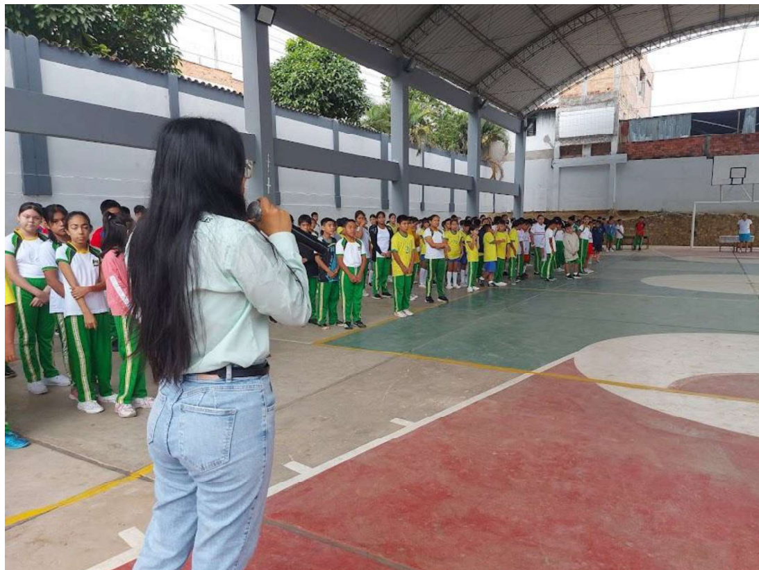
Ilustración 7: Capacitación en la I.E. "Tarapoto".