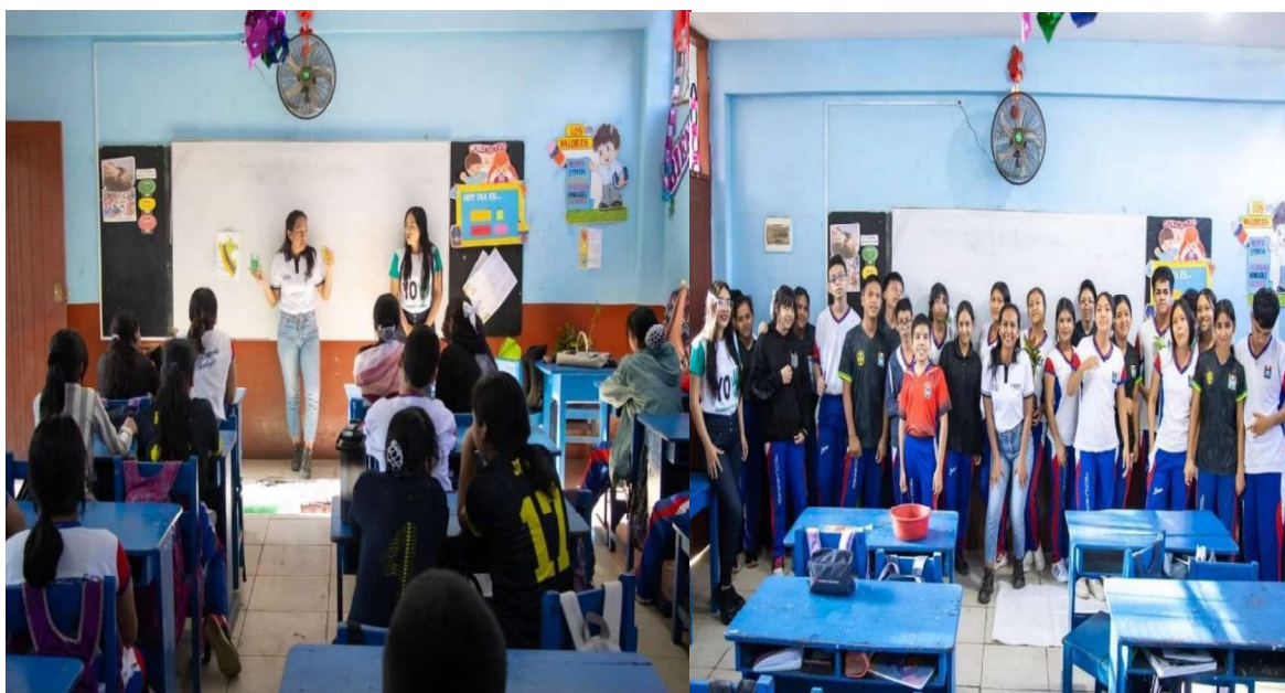
Ilustración 3: Capacitación en la I.E. "Juanita del Carmen Sánchez Rojas".