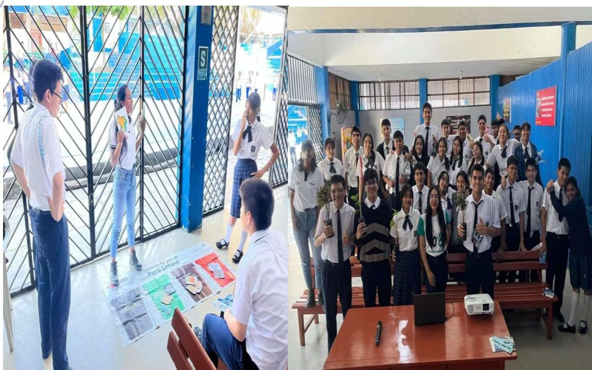
Ilustración 4: Capacitación en la I.E. "Ofelia Velázquez".