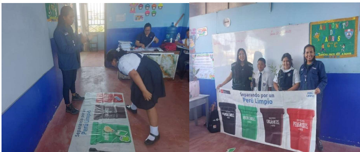
Ilustración 2: Capacitación en la I.E. "JARA".