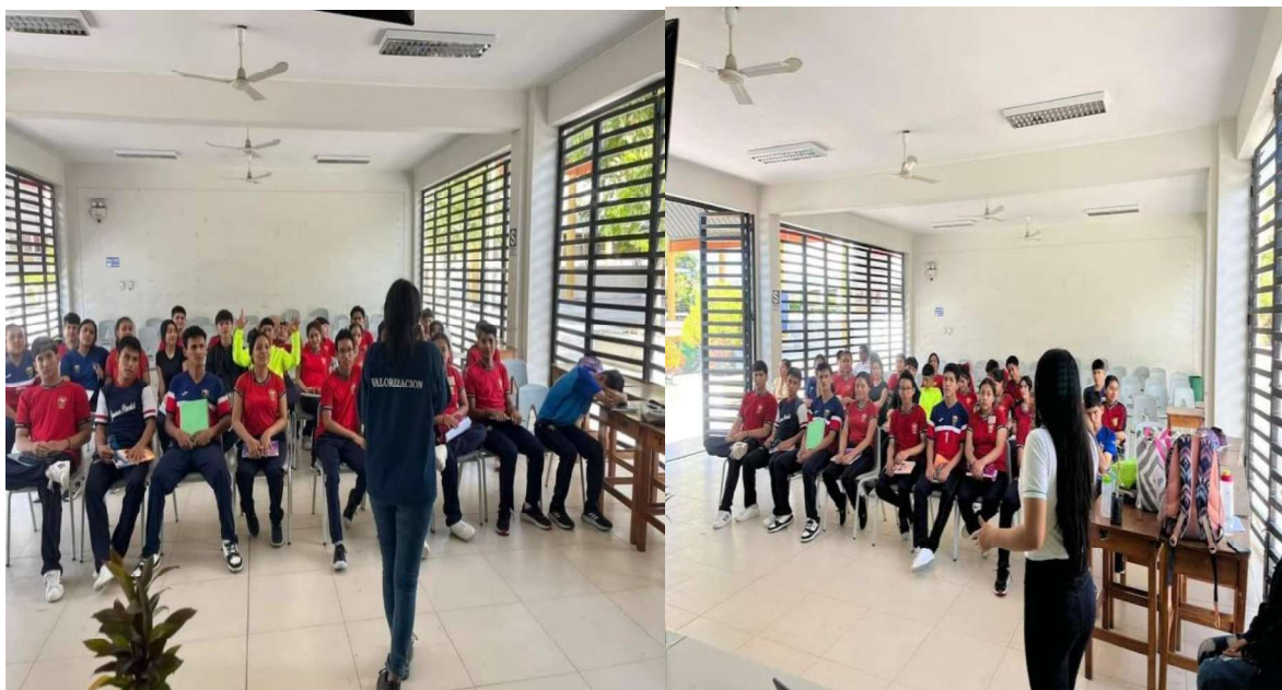
Ilustración 5: Capacitación en la I.E. "Jiménez Pimentel".