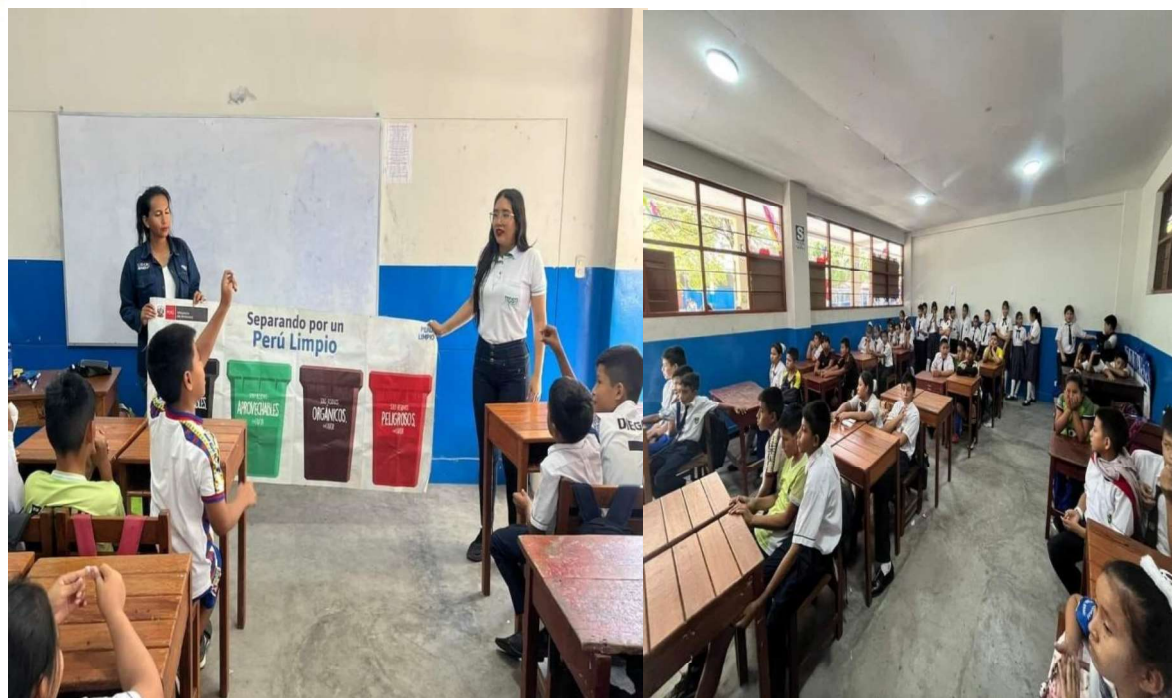
Ilustración 6: Capacitación en la I.E. "Tupac Amaru".