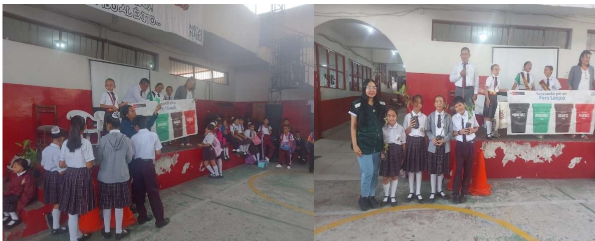
Ilustración 1: Capacitación en la I.E. "0018".