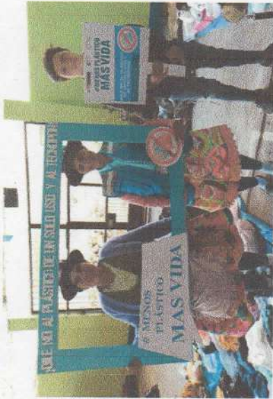
Foto N° 1, 2, 3, 4 y 5 campañas informativas de menos plástico más vida