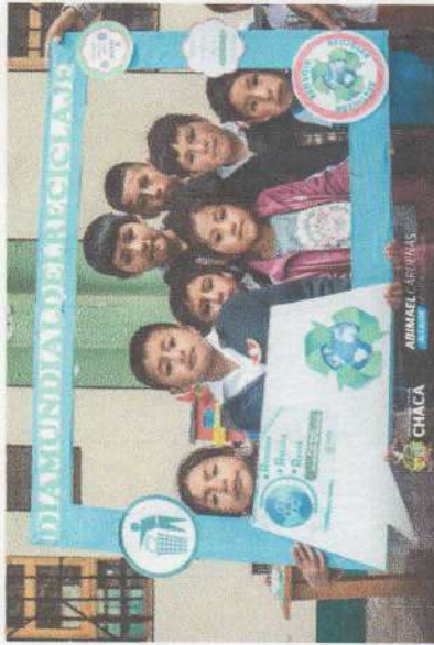
Foto N°6,7,8,9 y 10 campañas informativas recicla ya en el marco del día mundial del reciclaje