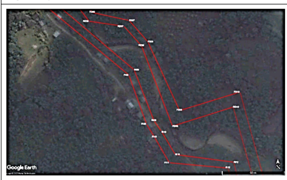
Figura 2. Vértices 8-11 de la margen izquierda y vértices 7-8 de la margen derecha de la propuesta de faja marginal correspondiente al lindero interior dentro del cauce.