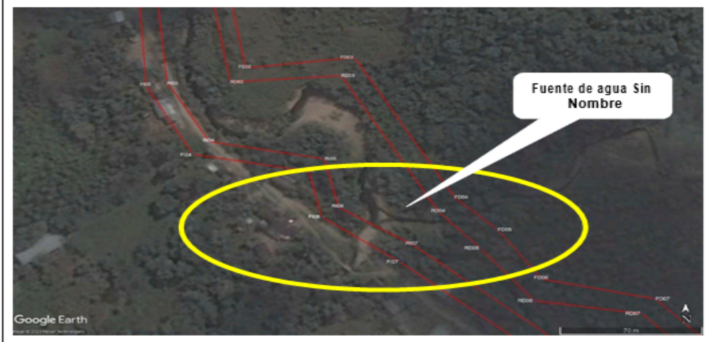
Figura 1. Tramo de los vértices 6 y 7, donde se observa una fuente de agua perpendicular a la quebrada Huipoca.